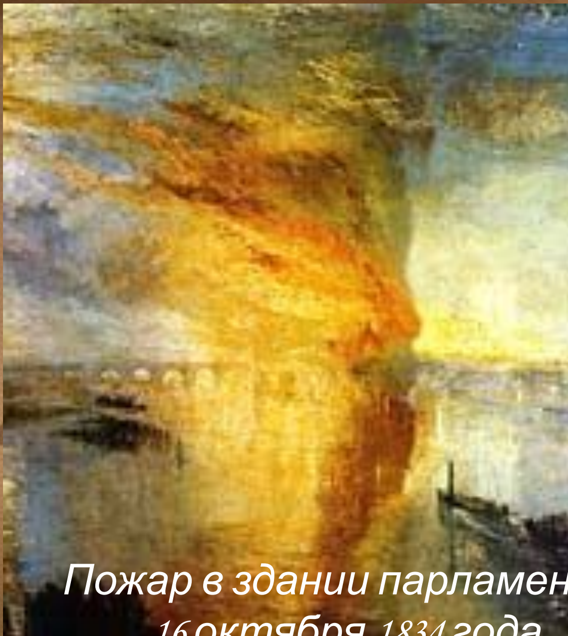
Пожар в здании парламента 16 октября 1834 года