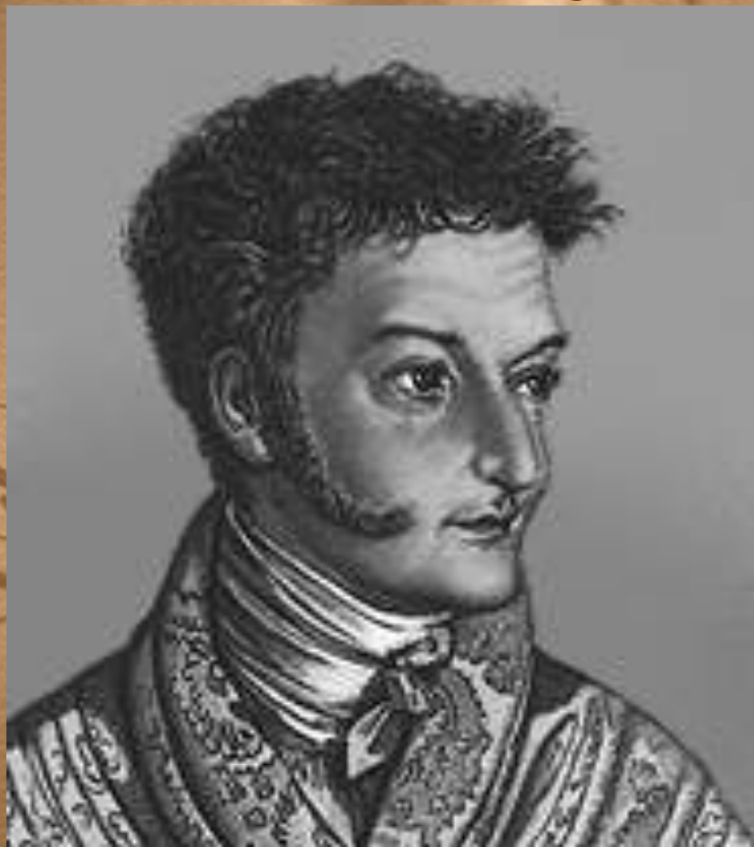
Эрнст Теодор Амадей Гофман