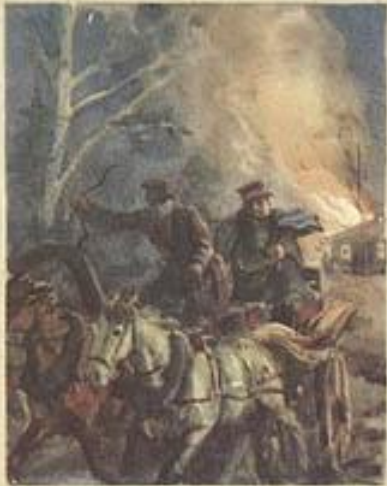
А.С. Пушкин ДУБРОВСКИЙ

Протестует против беззакония, произвола, несправедливо сти. Пытается изменить свою судьбу