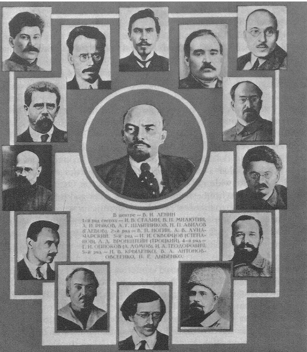
В центре — В. И. ЛЕНИН 1-й ряд сверху — И. В. СТАЛИН, В. П. МИХАЙЛОВ, А. И. РИЗОВ, А. Г. ШЛЯХОВИЧ, Н. П. АФАНАСОВ, П. М. МАСЛОВ; 2-й ряд — В. П. ГОРИН, А. В. ЛУНА- ЧАРСКИЙ; 3-й ряд — И. И. СВЯТОМИРОВ (СТЕПАНОВ), А. А. БРОДСКИЙ (ПРОЦКИЙ); 4-й ряд — Г. И. ОШОКОВ (А. ДОМОВ), И. А. ТЕОДОРОВИЧ; 5-й ряд — П. В. КРЫЛЕНКО, В. А. АНТОНОВ- ОВСЕНКО, П. Е. ДЫБЕНКО.

СОВЕТ НАРОДНЫХ КОМИССАРОВ, ИЗБРАННЫЙ НА ВТОРОМ ВСЕРОССИЙСКОМ СЪЕЗДЕ СОВЕТОВ РАБОЧИХ И СОЛДАТСКИХ ДЕПУТАТОВ