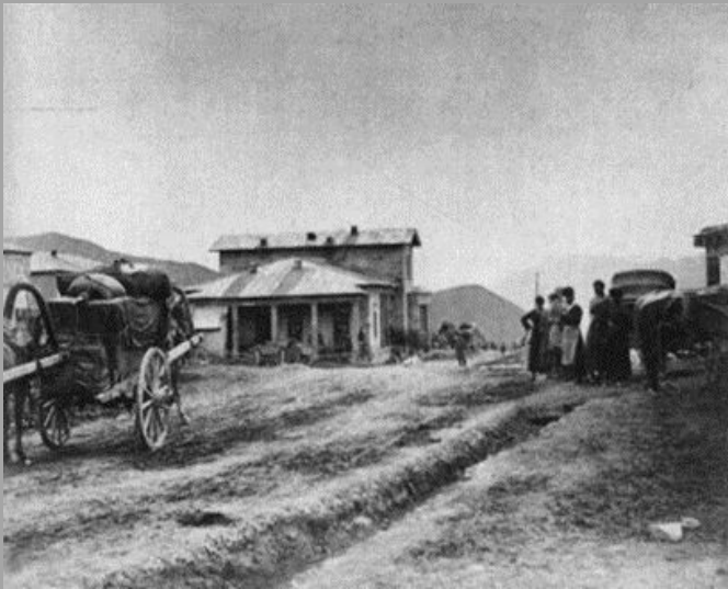
Здание почтовой станции в Гудаури