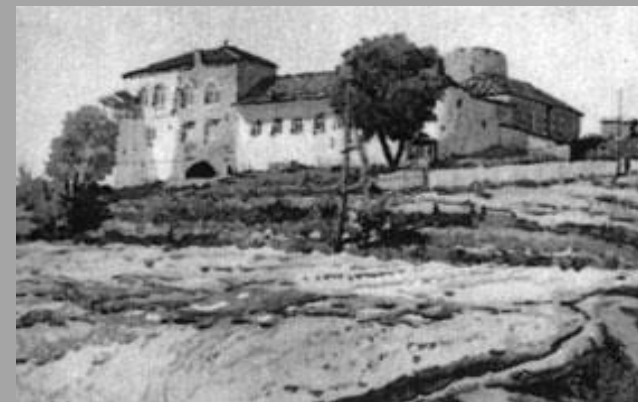
Дом Б. Чилева