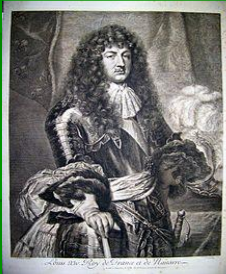
Людовик XIV в 1670