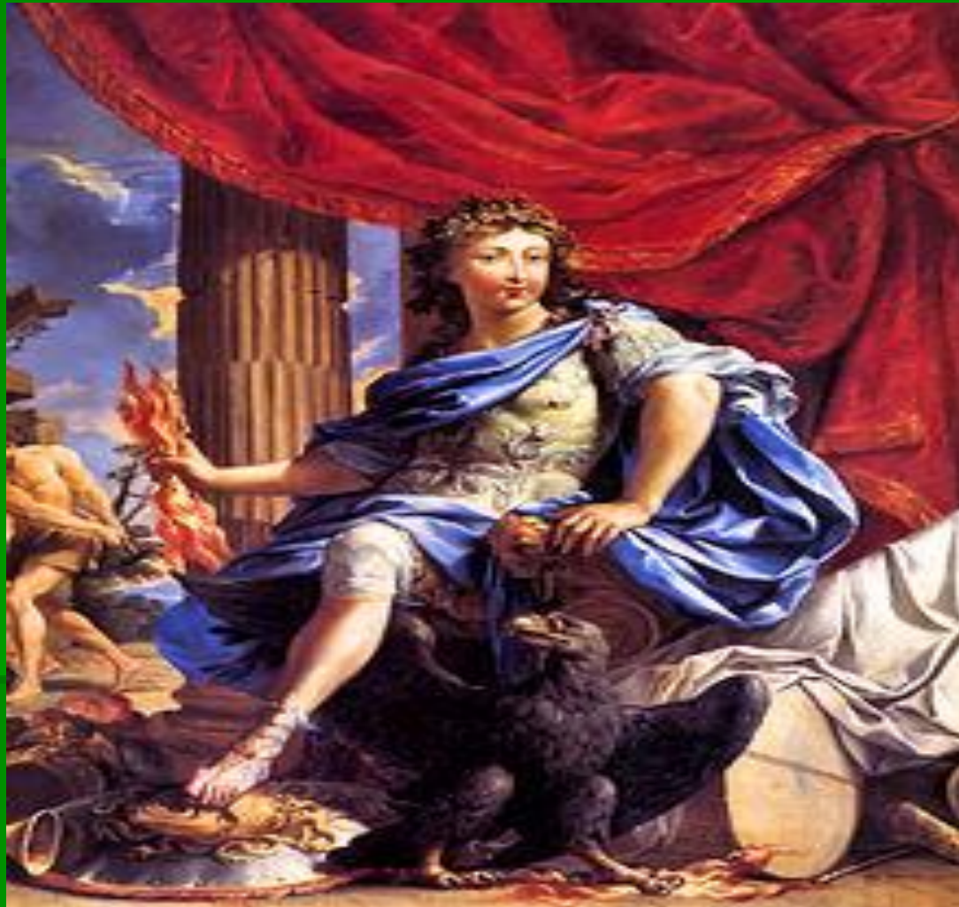
Людовик XIV в образі Юпітера