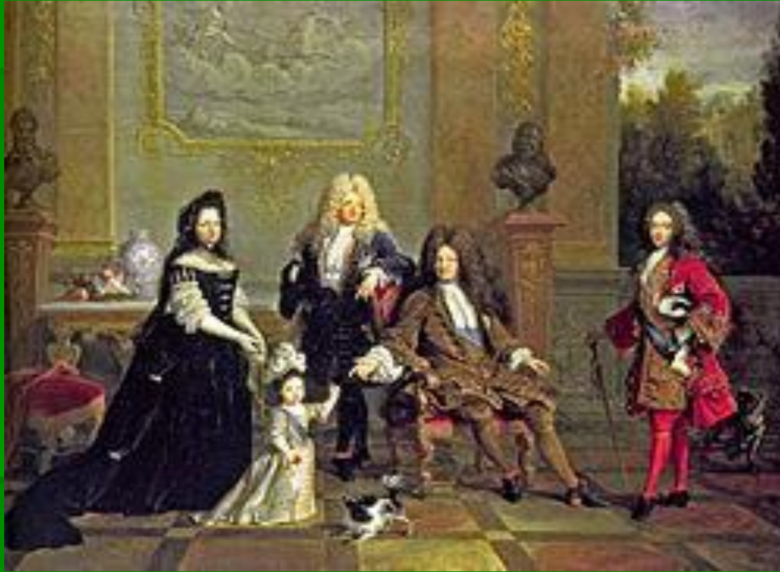
Ніколя де Ларжийєр. Портрет Людовика XIV з родиною