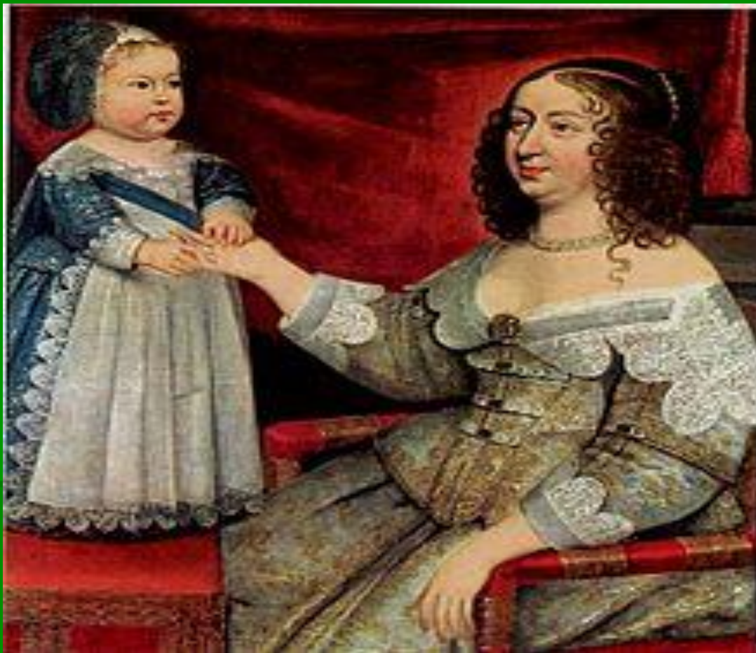
Анна Австрійська з сином — майбутнім королем Людовиком XIV