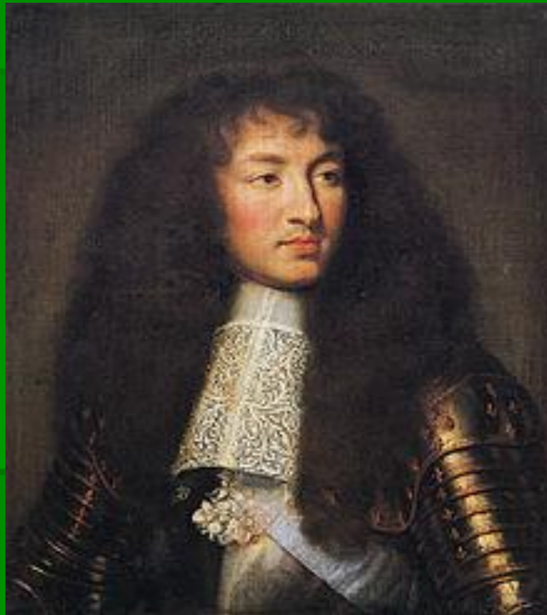
Людовик XIV в 1661, автор — Шарль Лебрен