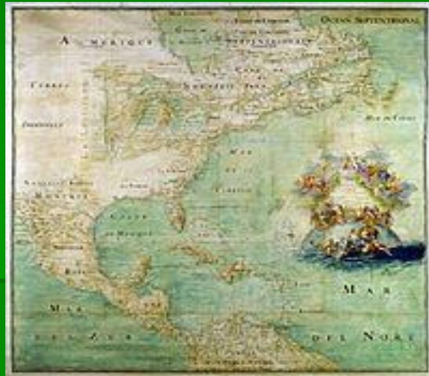
Карта Америки в 1681