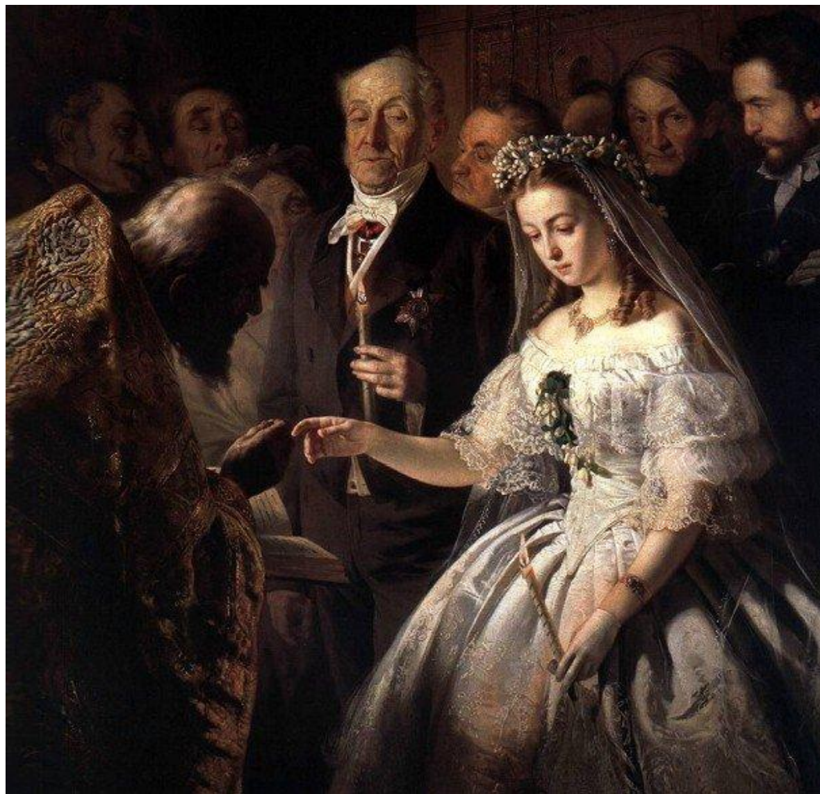
Неравный брак. Василий Пукирев.