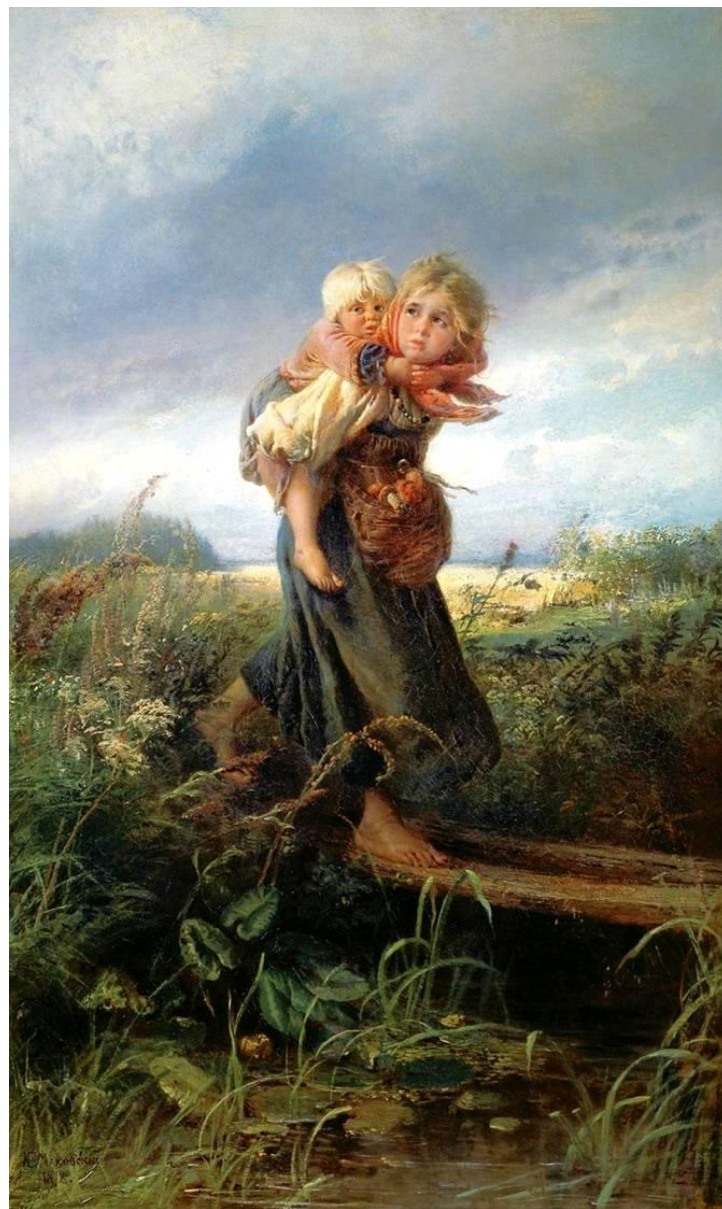
Маковский. Дети, бегущие от грозы