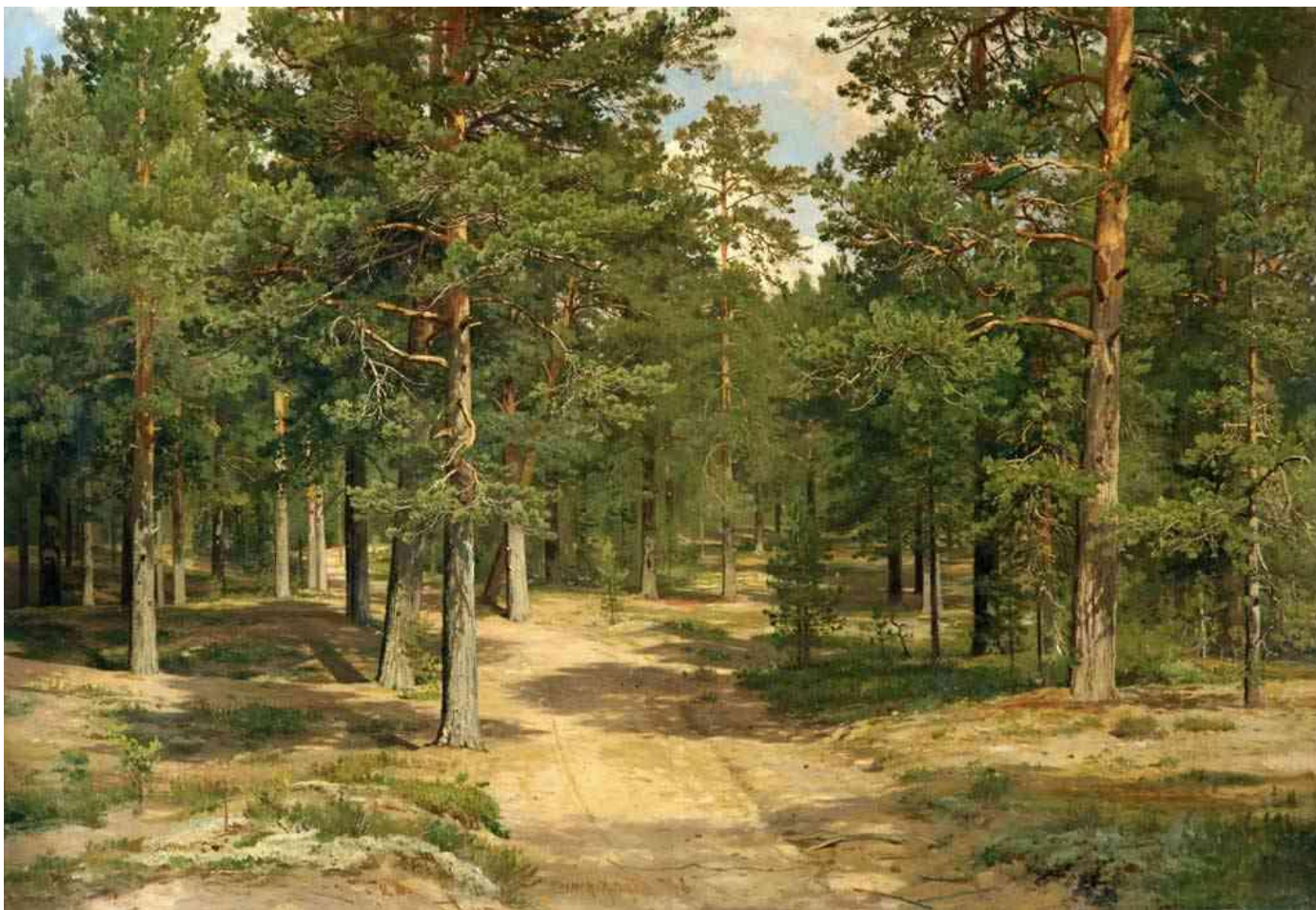
Иван Шишкин. Сестрорецкий бор.