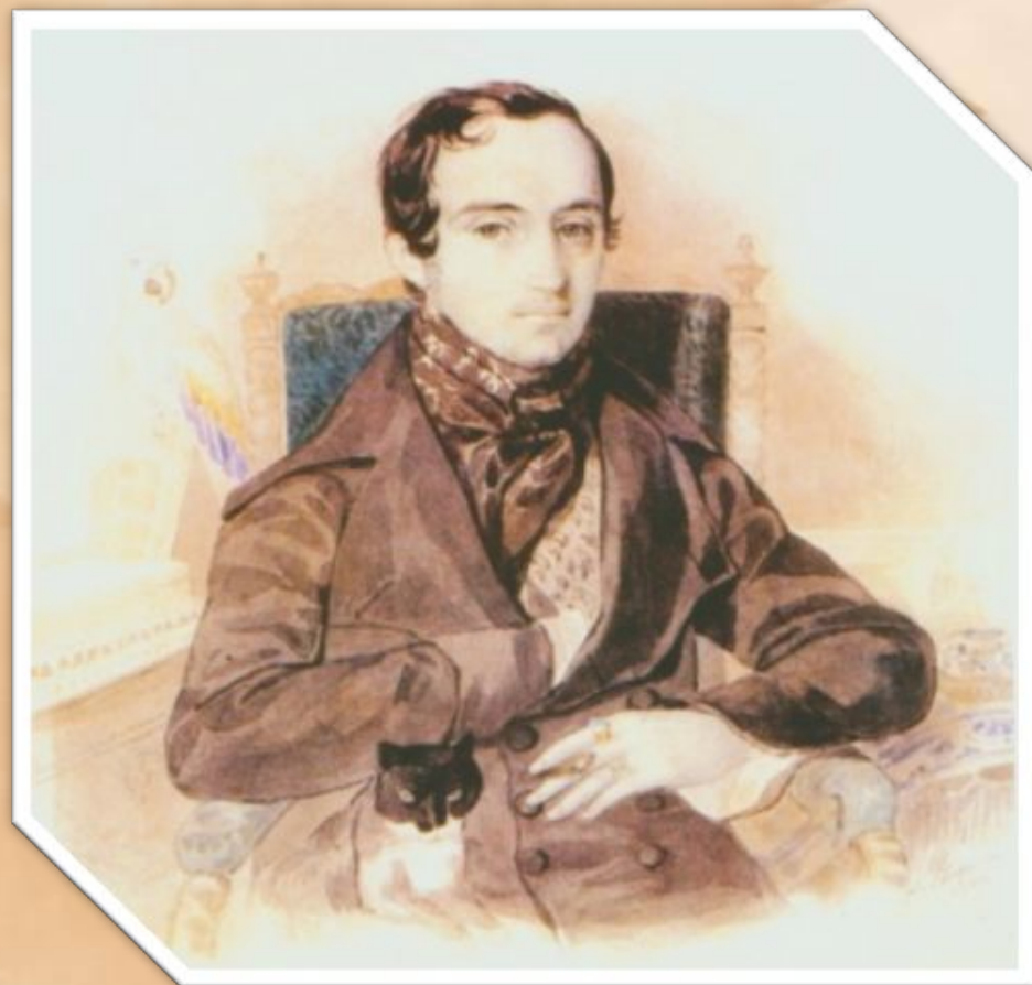
Владимир Фёдорович Одоевский (1803 – 1869 ) князь — русский писатель, философ, педагог, музыковед