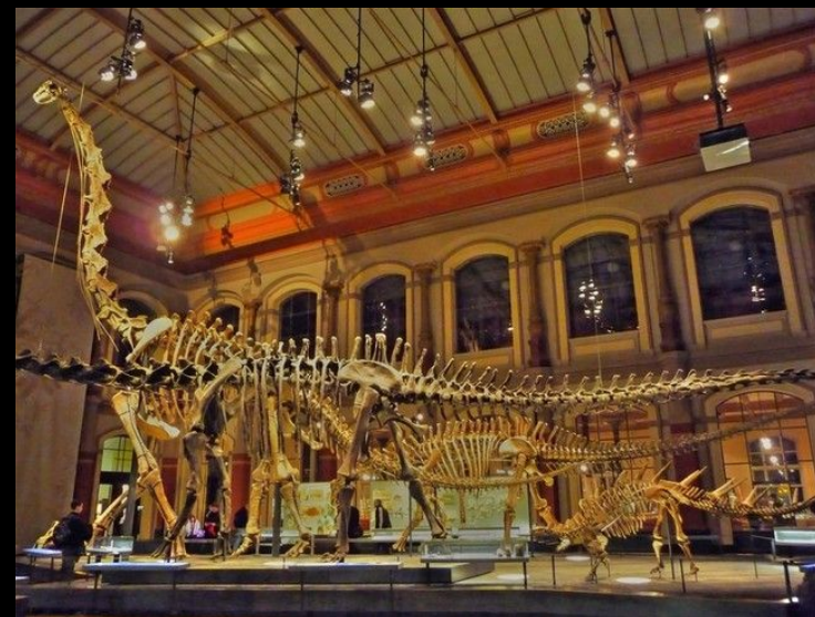
Берлинский Музей Естествознания