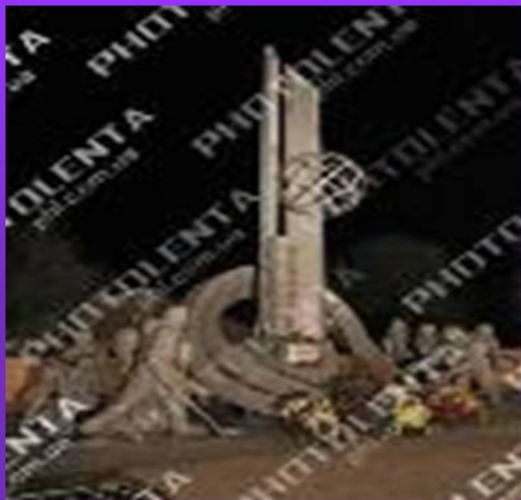
памятник героям Чернобыля