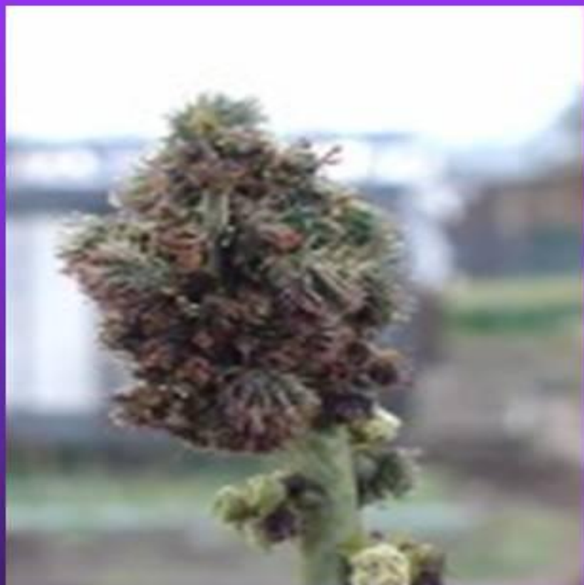
мутант Цветик семицветик