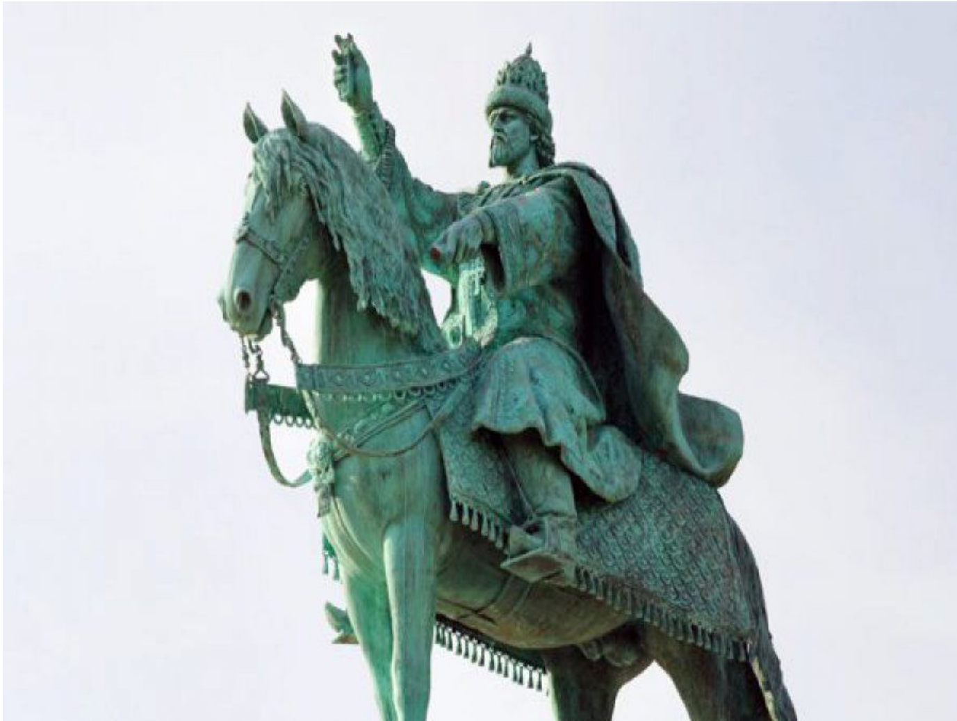
Памятник Ивану Грозному в Орле