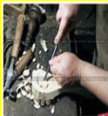
Первый шаг: расщепление деревянной заготовки. Выравнивание