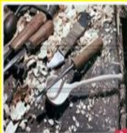
Первый шаг: расщепление деревянной заготовки. Готовая ложка