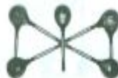
Бабочка Две пары крыльев быстро машут, С цветка она порхает на цветок, В улетает от саака, Не зверь, а хресто... бабочка.