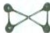
Баян На холме донычит Мы шлем кругом Из земли устройство, Зовется... баяном.