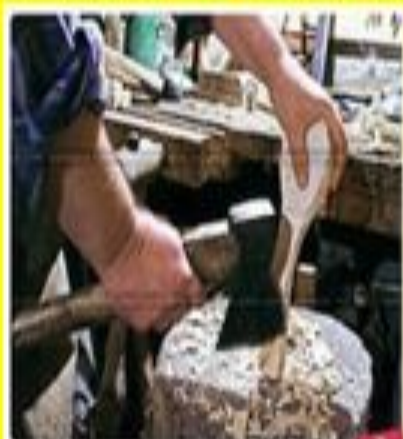
Первый шаг: расщепление деревянной заготовки