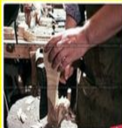
Шаги: выравнивание деревянной заготовки