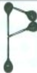
Флажок (вариант № 1) Крепко держит в руке древо, А на нем — цветная топь, На заряд берн, дружок, Рыноцветный слоб... флажок.