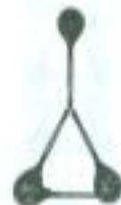
Балалайка Треугольная доска, Три струны висят на ней, Ну-ка, звонко заиграй-ка, Баля... баля... балалайка.