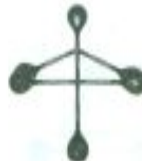
Самолет Летчик машину По небу водит, Крылатое устройство Лодит... самолет!