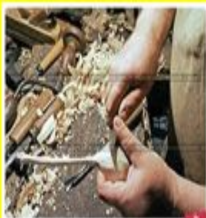
Первый шаг: расщепление деревянной заготовки. Выравнивание