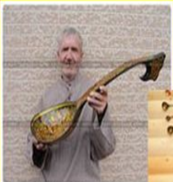
Дедушка держит в руках большую старинную деревянную ложку