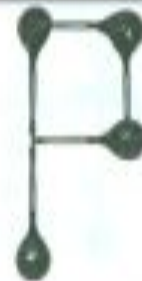
Флажок (вариант № 2)