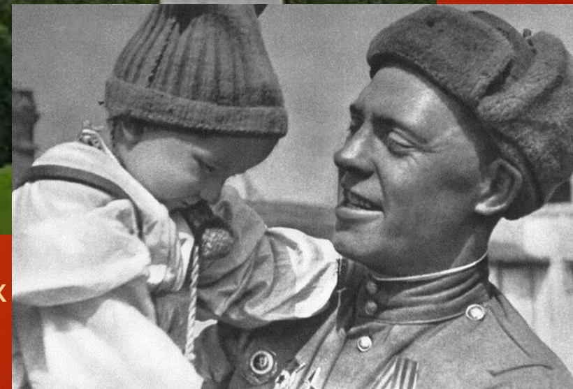
Красноармеец с ребенком на руках