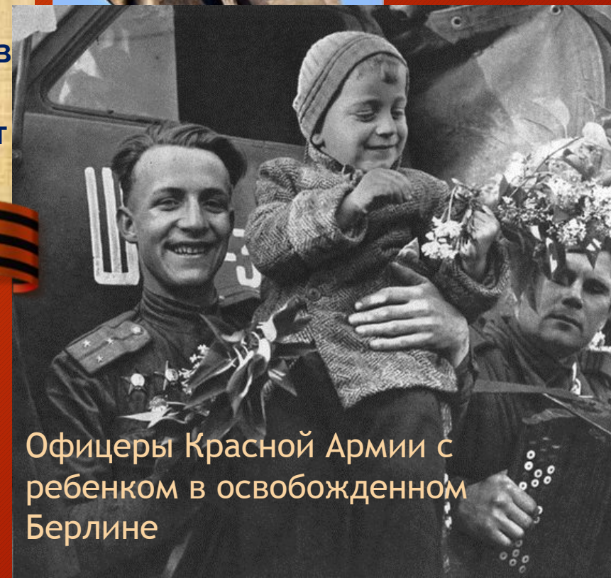
Офицеры Красной Армии с ребенком в освобожденном Берлине