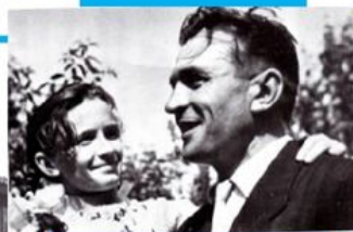
С дочерью Валентиной