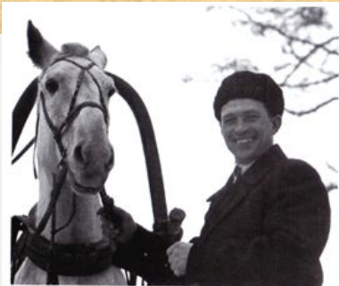
Солдатское счастье — жить за себя и за того парня