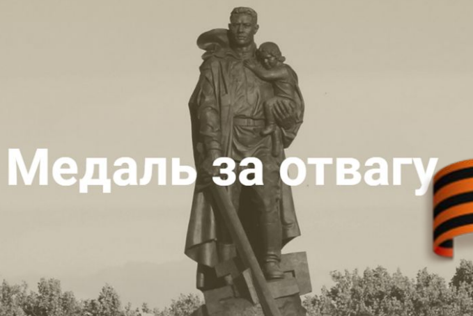
Медаль за отвагу