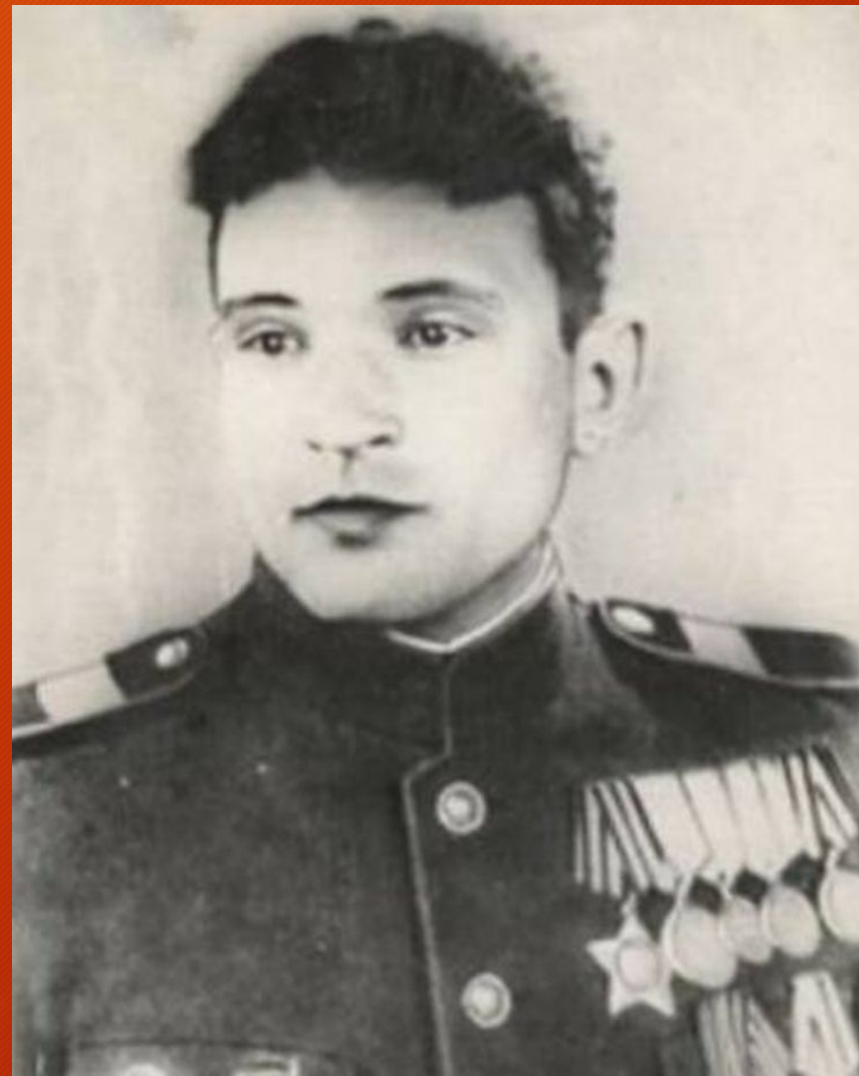
Гвардии старший сержант Николай Иванович Масалов (1922- 2001)

30 апреля 1945 года старший сержант Красной Армии Николай Масалов совершил подвиг, который вошел в историю как образец мужественности и добродетели, которыми всегда славился наш народ