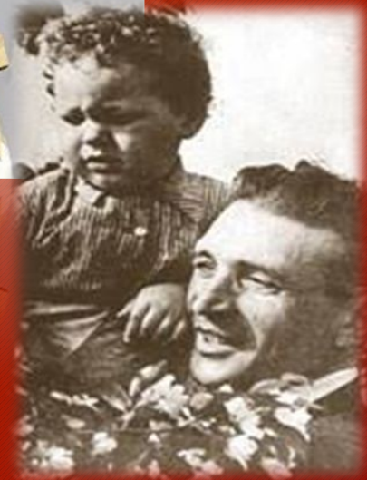
«Воин-освободитель» в берлинском Трептов-парке