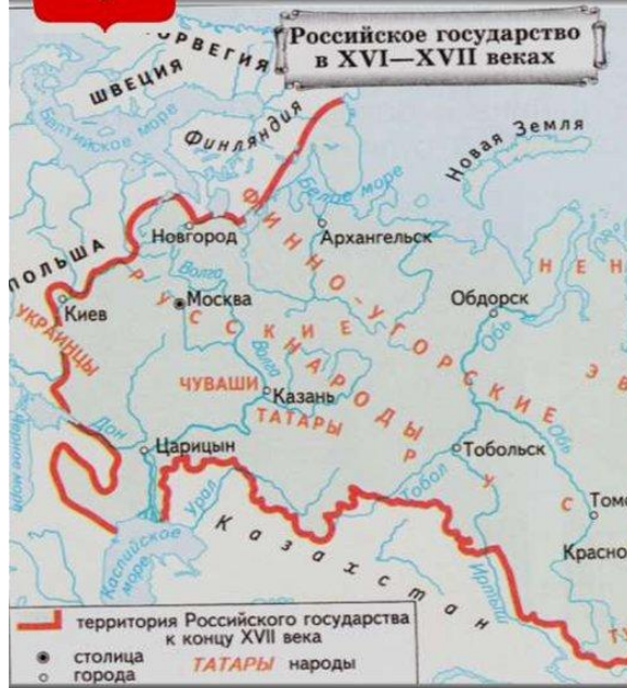
Российское государство в XVI—XVII веках