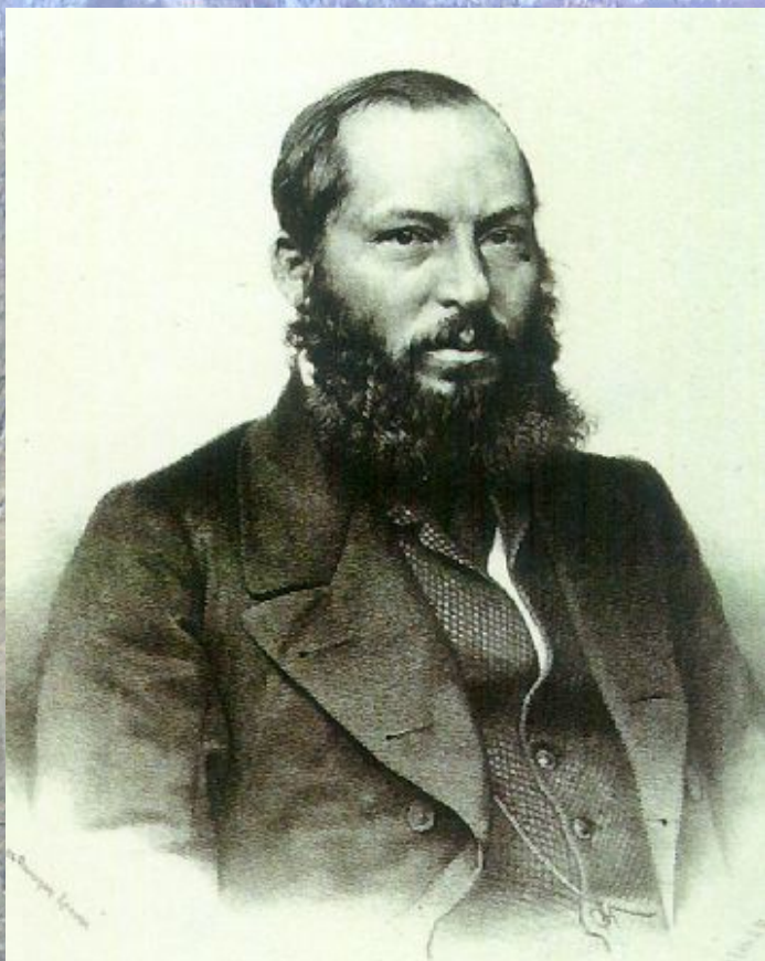
А.А.Фет, 1860 год