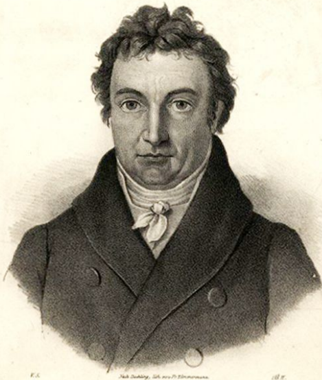
Johann Gottlieb Fichte.