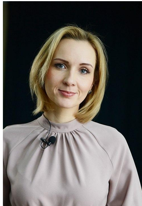
Львова-Белова, Мария Алексеевна

В России свыше 400 православных организаций помогают детям и взрослым с инвалидностью. Координирует эту работу Синодальный отдел по церковной благотворительности и социальному служению. Одно из ключевых направлений — создание альтернативы государственным интернатам в виде негосударственных проектов сопровождаемого проживания людей с инвалидностью.