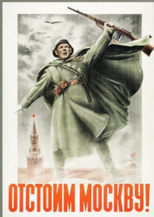
«Отстоим Москву!» 1941 год. Художники Н. Жуков и В. Климашин.