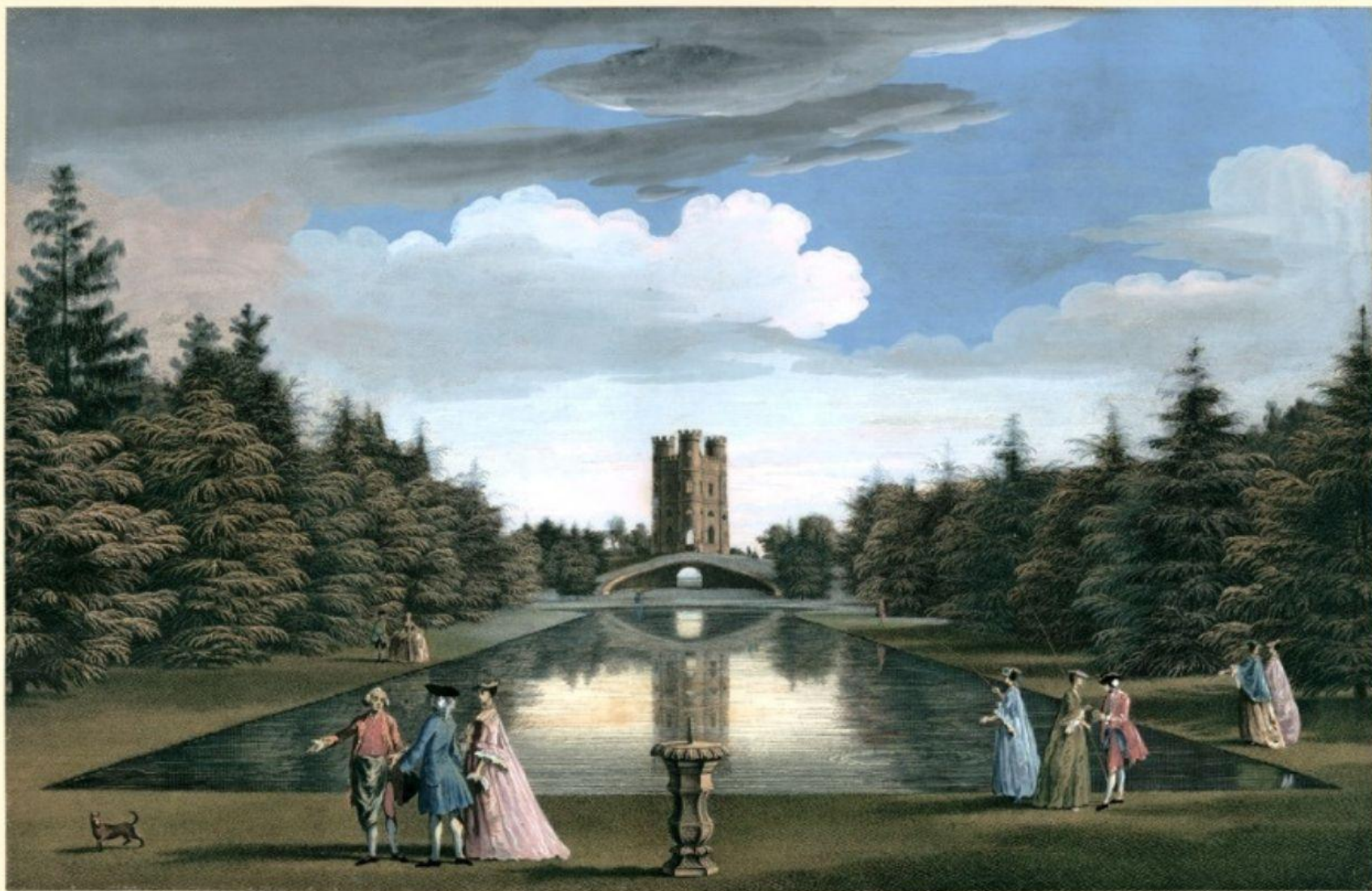
A View of the Canal and of the Golluck Tower in the Garden of His Grace the Duke of Argyl at Whilton.

Vue du Canal, et de la Tour Gothique dans le Jardin de M rs le Duc d'Argyl a Whilton a 4 lieues a l'ouest de Londres.