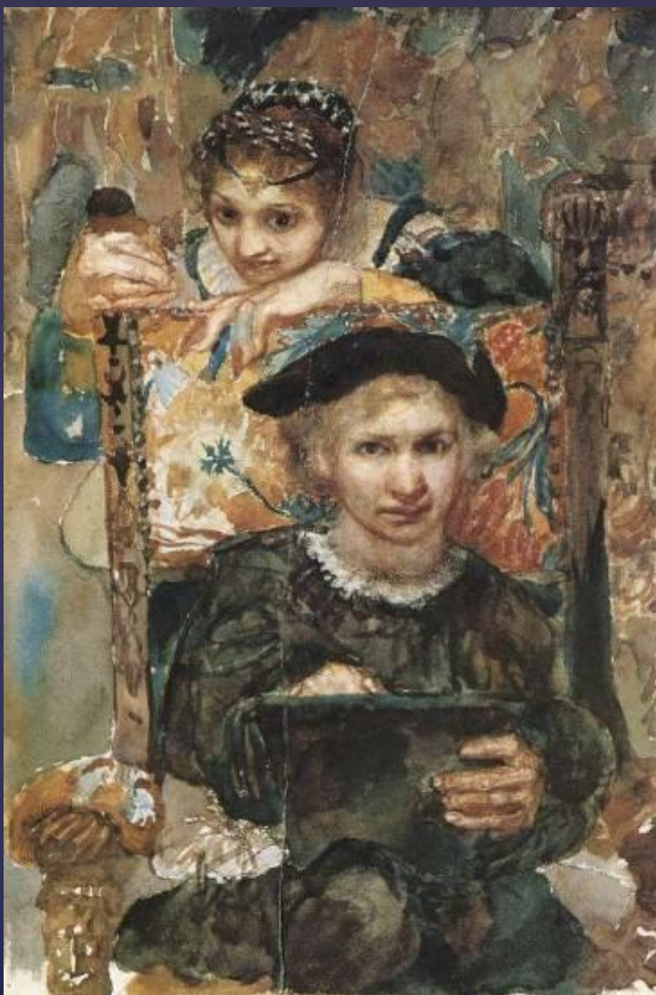
Гамлет и Офелия

Отец желал для Михаила надёжного и обеспеченного будущего, и потому после гимназии 18-летний Михаил поступил на юридический факультет Санкт-Петербургского университета . Он был совершенно равнодушен к юридическим наукам. Он всерьёз увлекался философией, влюблялся в оперных актрис, спорил об искусстве и много рисовал. В возрасте 23 лет Михаил окончил университет с золотой медалью. После этого отбыл воинскую повинность, получив чин бомбардира запаса.