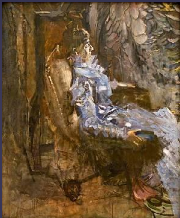
Дама в лиловом. Портрет Н. И. Забелы -Врубель