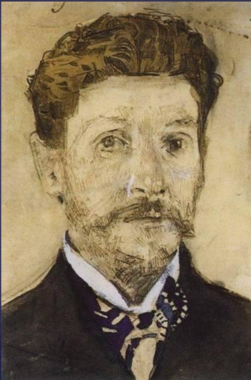
Врубель Михаил Александрович 1856 — 1910