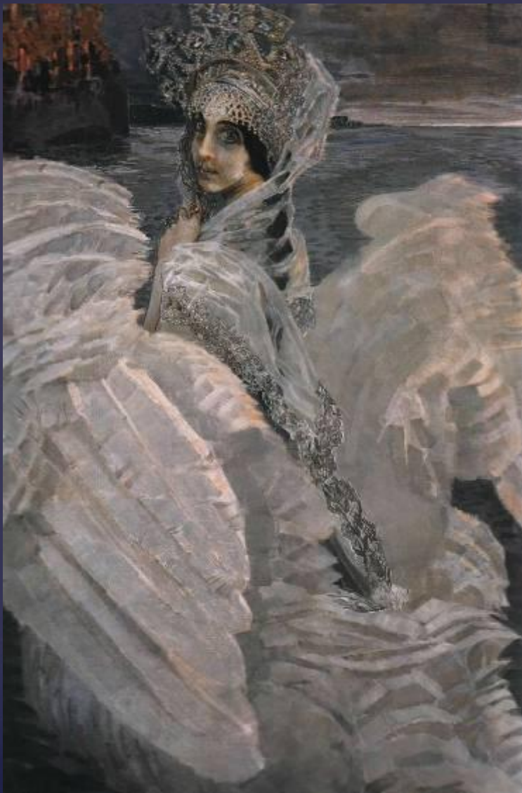
Царевна - лебедь