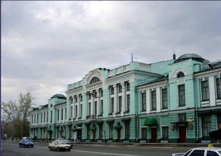
Музей изобразительных искусств им. Врубеля. Омск

В Омске на левом берегу Оми есть сквер Врубеля. Памятник в Омске возле Музея изобразительных искусств.