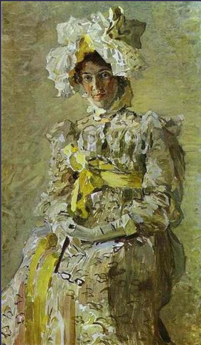
Жена художника, (1898)

В Санкт-Петербурге в Панаевском театре Михаил познакомился с певицей Надеждой Забелой, своей будущей женой.