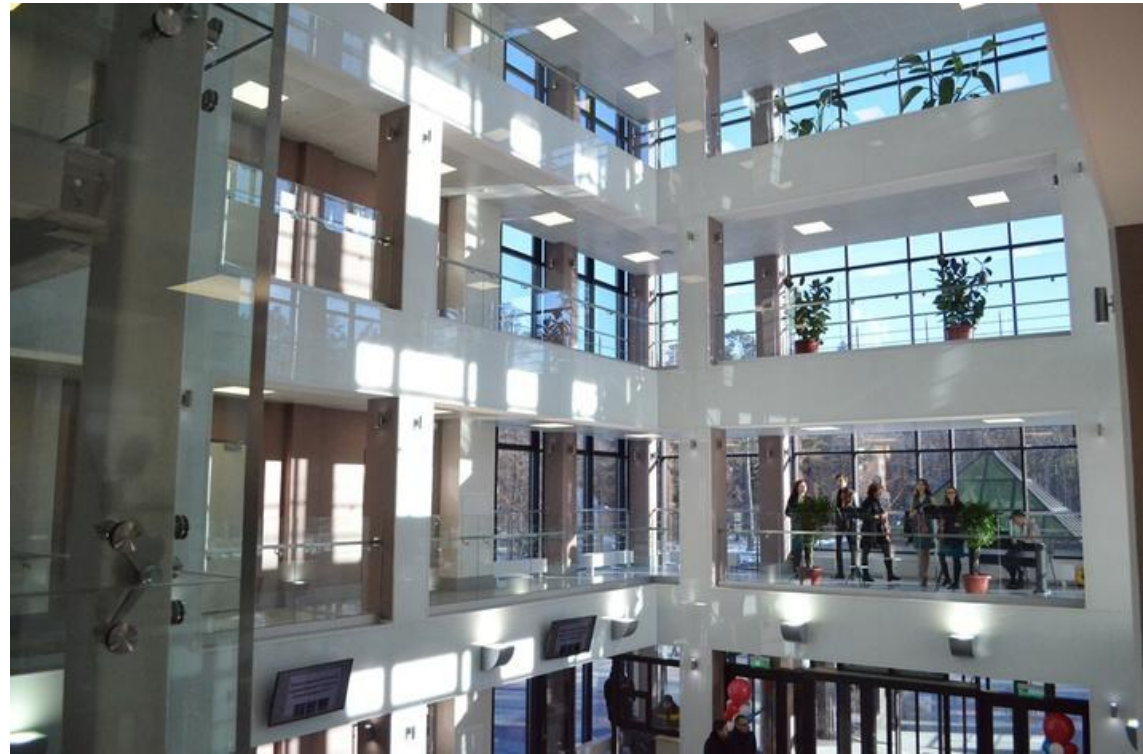
Финансовый университет при Правительстве Российской Федерации