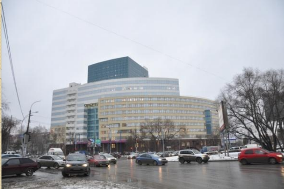
Тюменский нефтегазовый университет