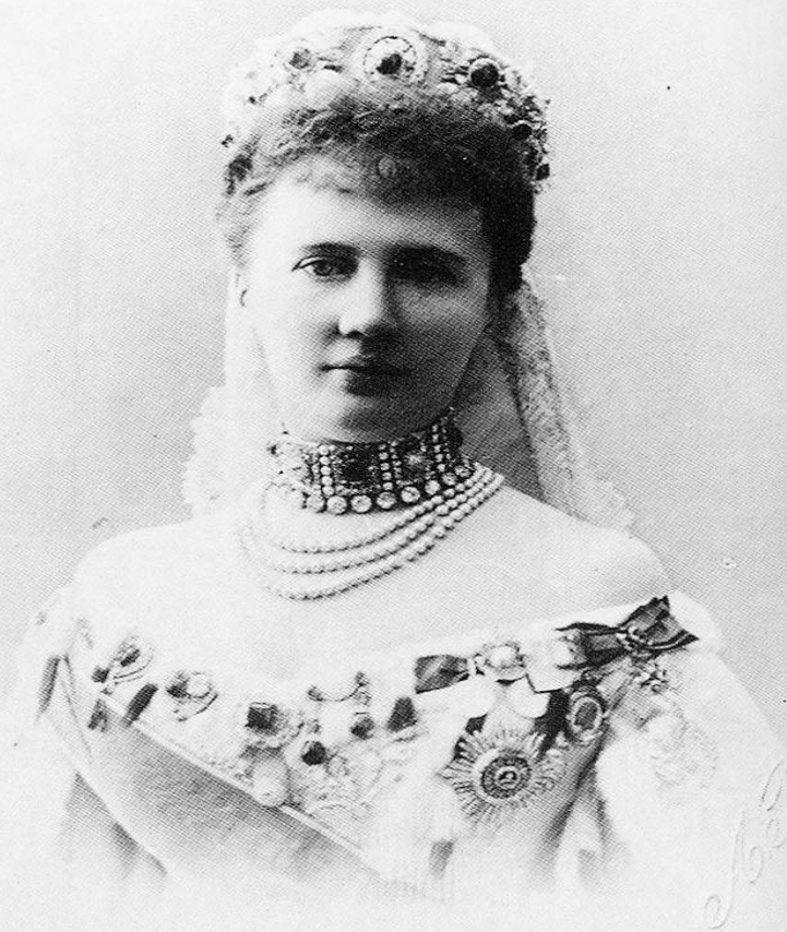
Великая княгиня Елизавета Маврикиевна, попечитель приюта, 1905 г.