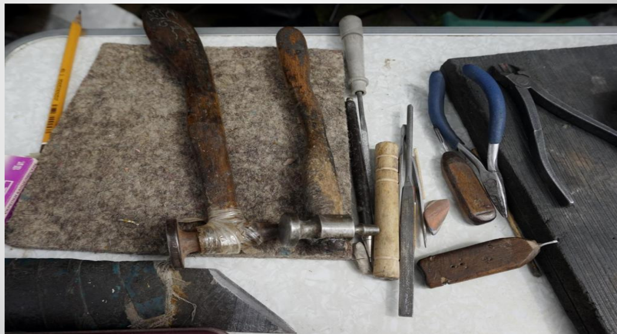
Инструменты мастера всечки