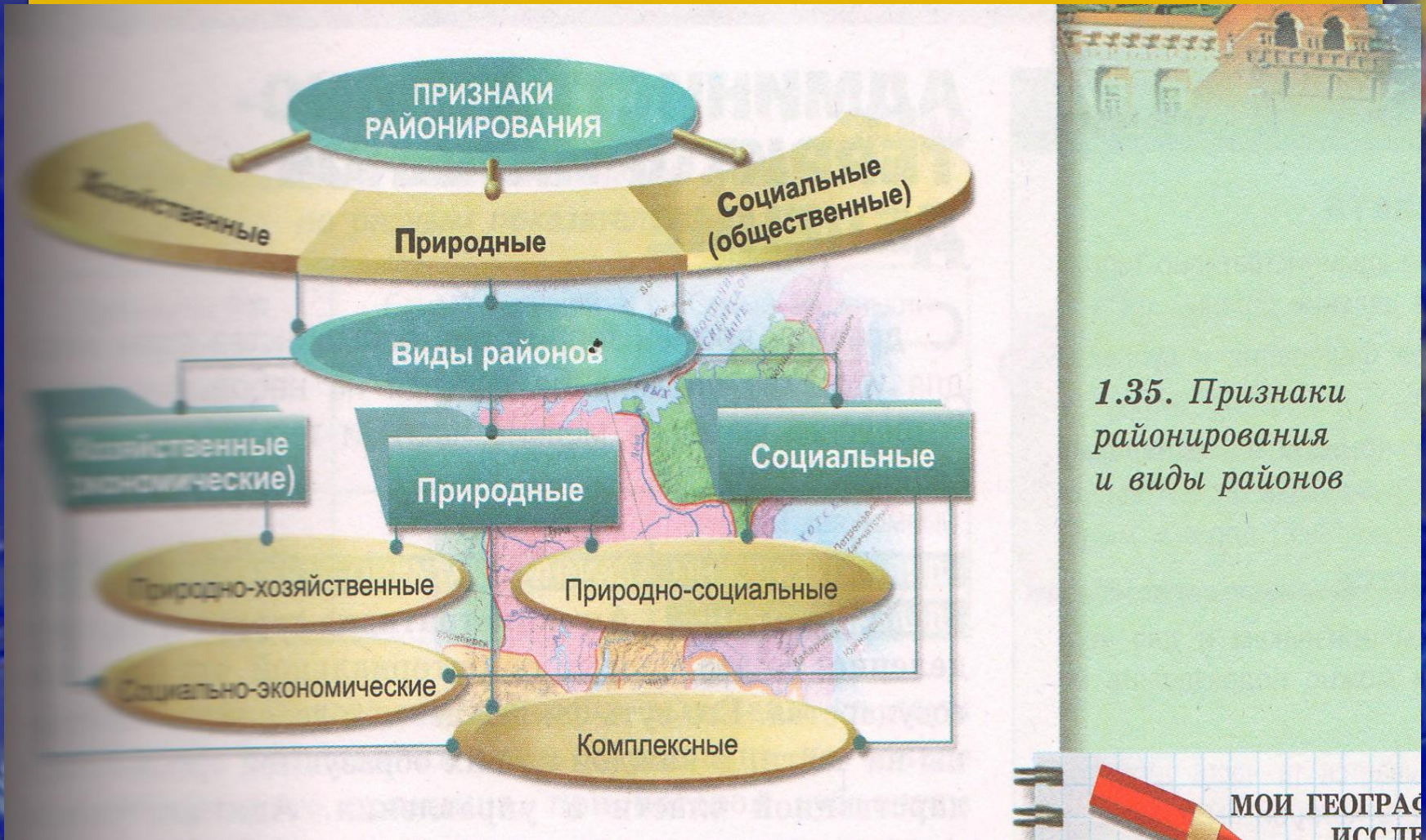
1.35. Признаки районирования и виды районов