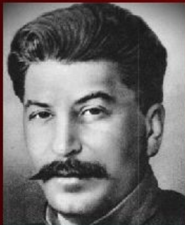
И. В. Сталин - нарком по делам национальностей