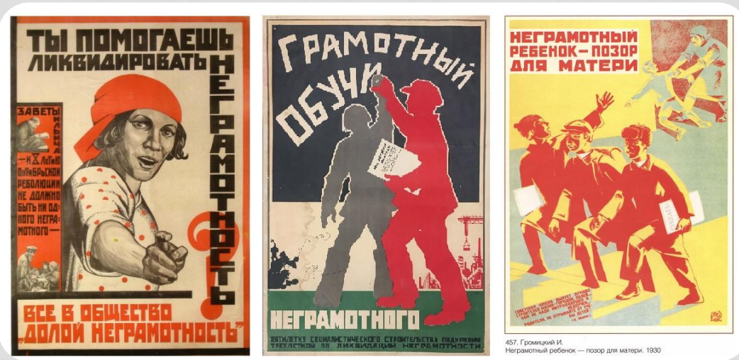
457. Грамичий И. Неграмотный ребенок — позор для матери. 1930