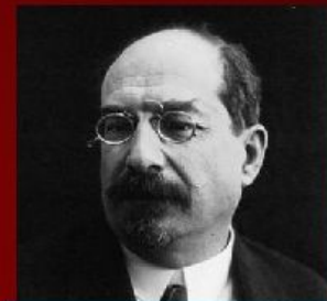
А. В. Луначарский - нарком просвещения