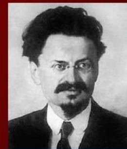
Л. Д. Троцкий - нарком иностраннх дел

нарком по делам национальностей И. В. Сталин -