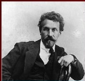
А. И. Рыков - нарком внутренних дел