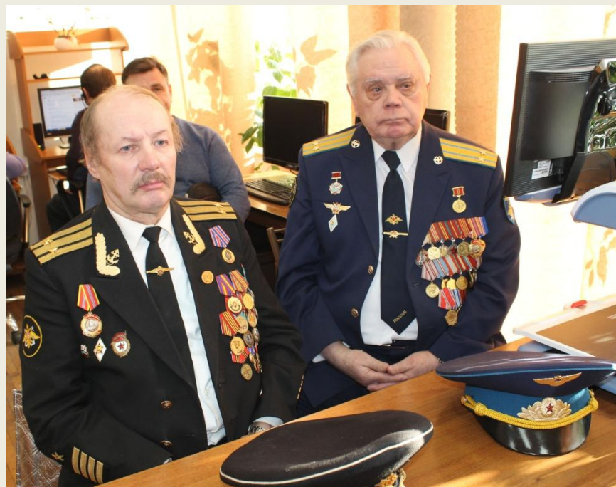
Сотрудничество с Советом ветеранов Кингисеппского района