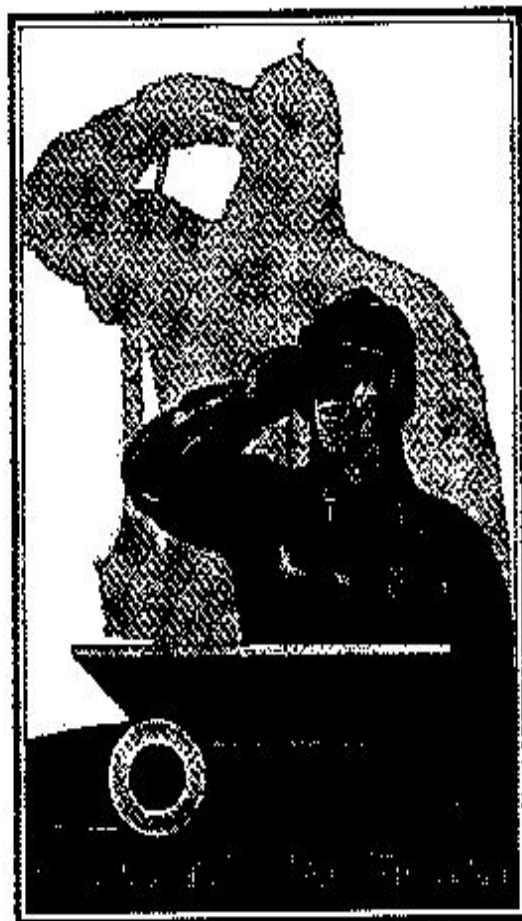
В. Говорков. Славна богатырями земля наша. 1941 г.

● Рассмотри плакат. Какой приём использовал автор, чтобы раскрыть тему защиты Отечества?