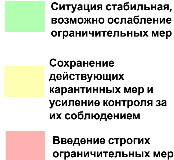
Матрица оценки эпидемиологической ситуации в РК (на 12.06.2021)