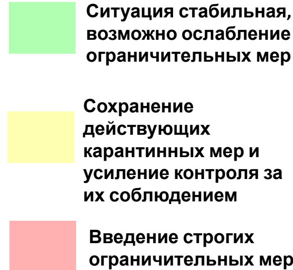
Матрица оценки эпидемиологической ситуации в РК (на 12.06.2021)