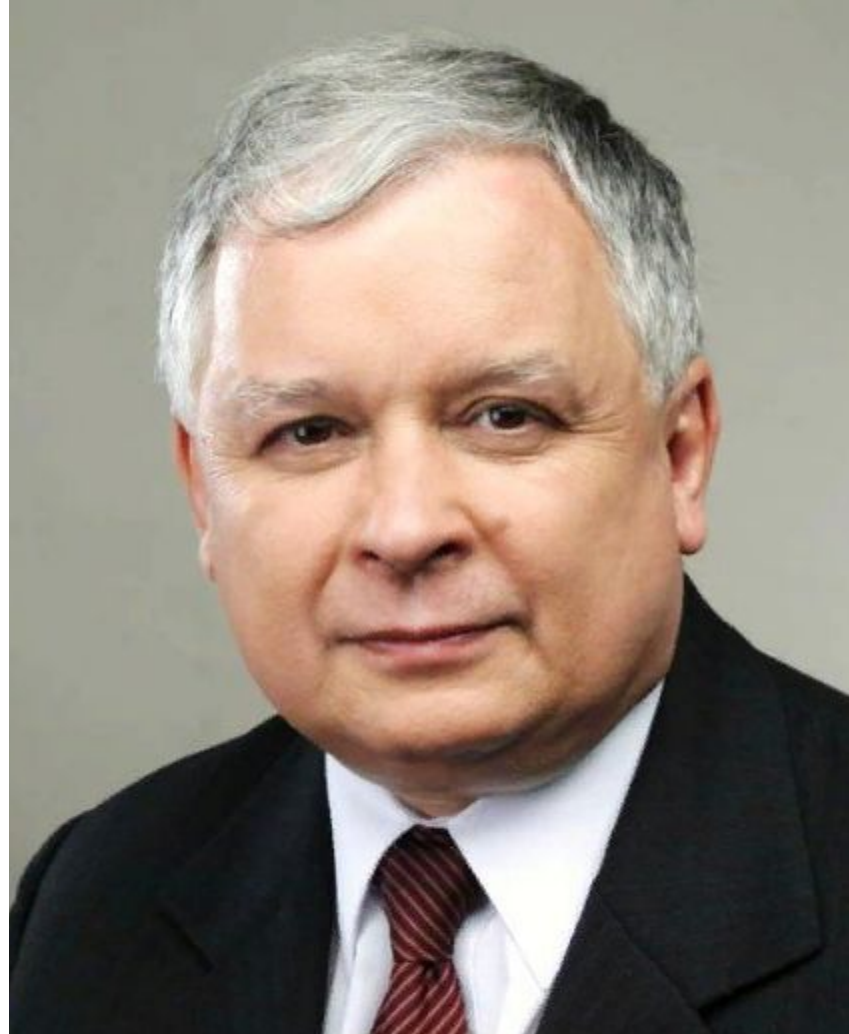
Президент Польши (2005 – 2010 гг.)

? Чью сторону занял президент Польши во время конфликта России и Грузии в Южной Осетии в 2008 г.?