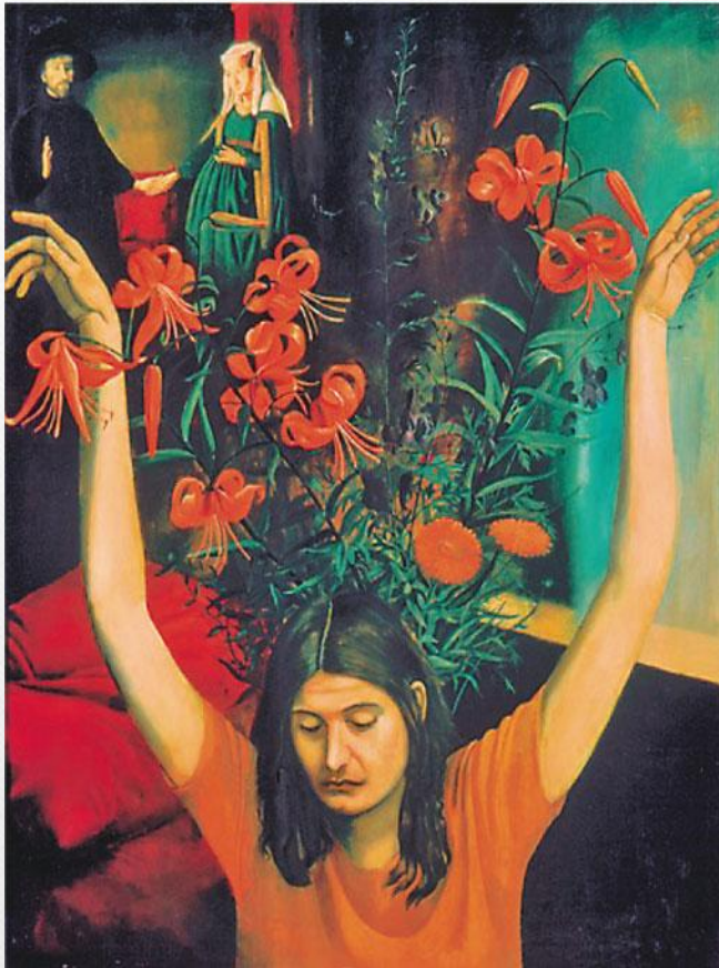
Т. Назаренко: Живопись: 1970-е годы.

Среди её произведений можно встретить и натюрморты, и пейзажи, и портреты, и бытовые сценки.