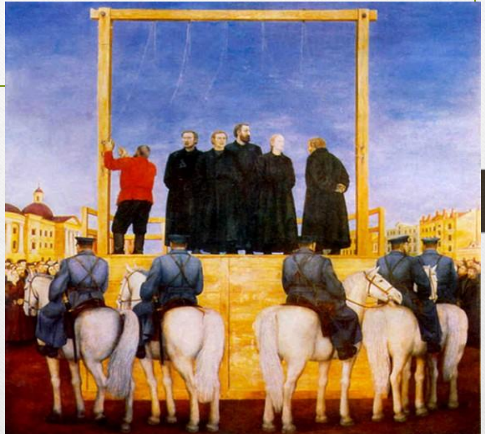
Т. Назаренко Казнь народовольцев 1969.