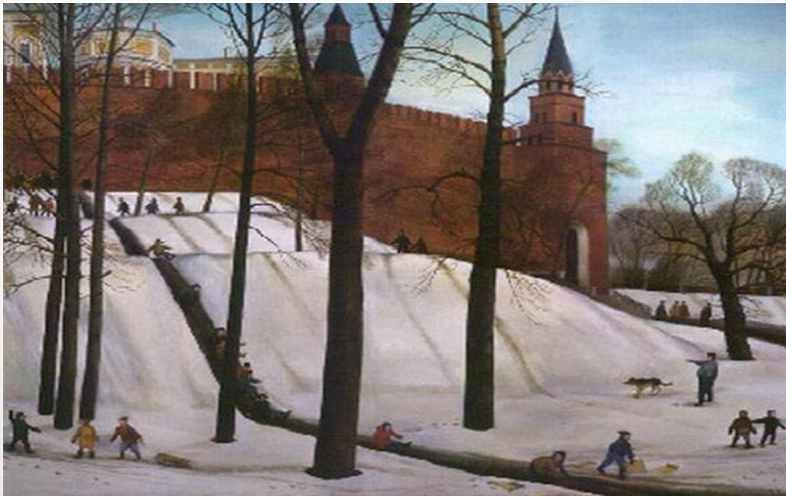
Татьяна Назаренко: Живопись: 1990-е годы.