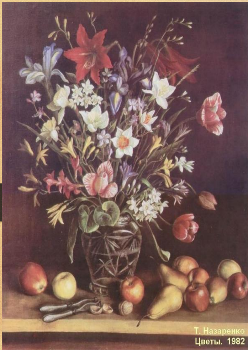
Назаренко Т. Цветы.