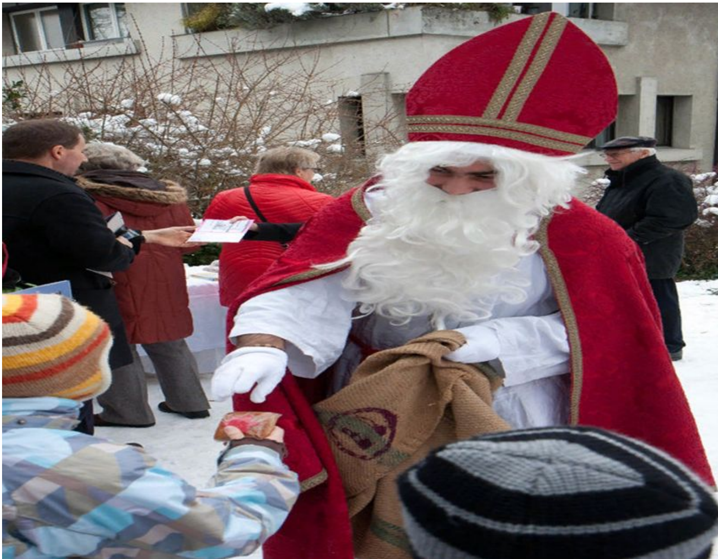
Weihnachtsmann. Фотоотчет с урока-игры