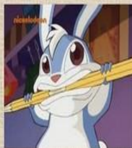
грызть карандаш или ручку