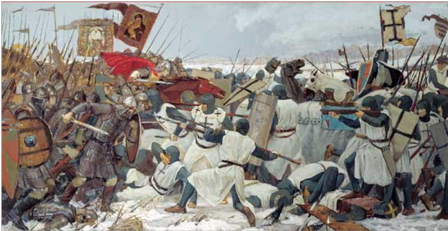
В. Маторин «Ледовое побоище»