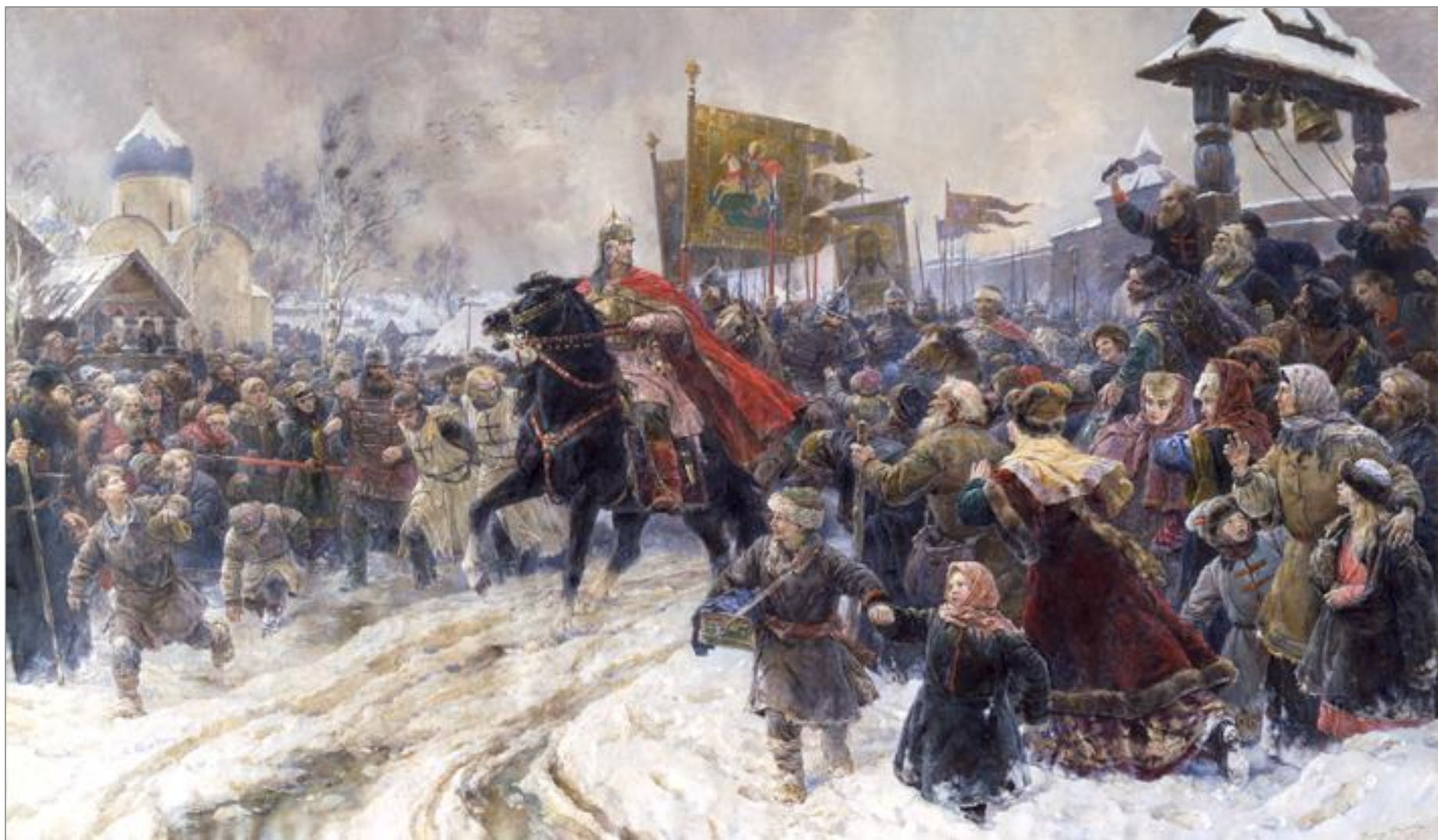
В. А. Серов. «Въезд Александра Невского в Псков после Ледового побоища».