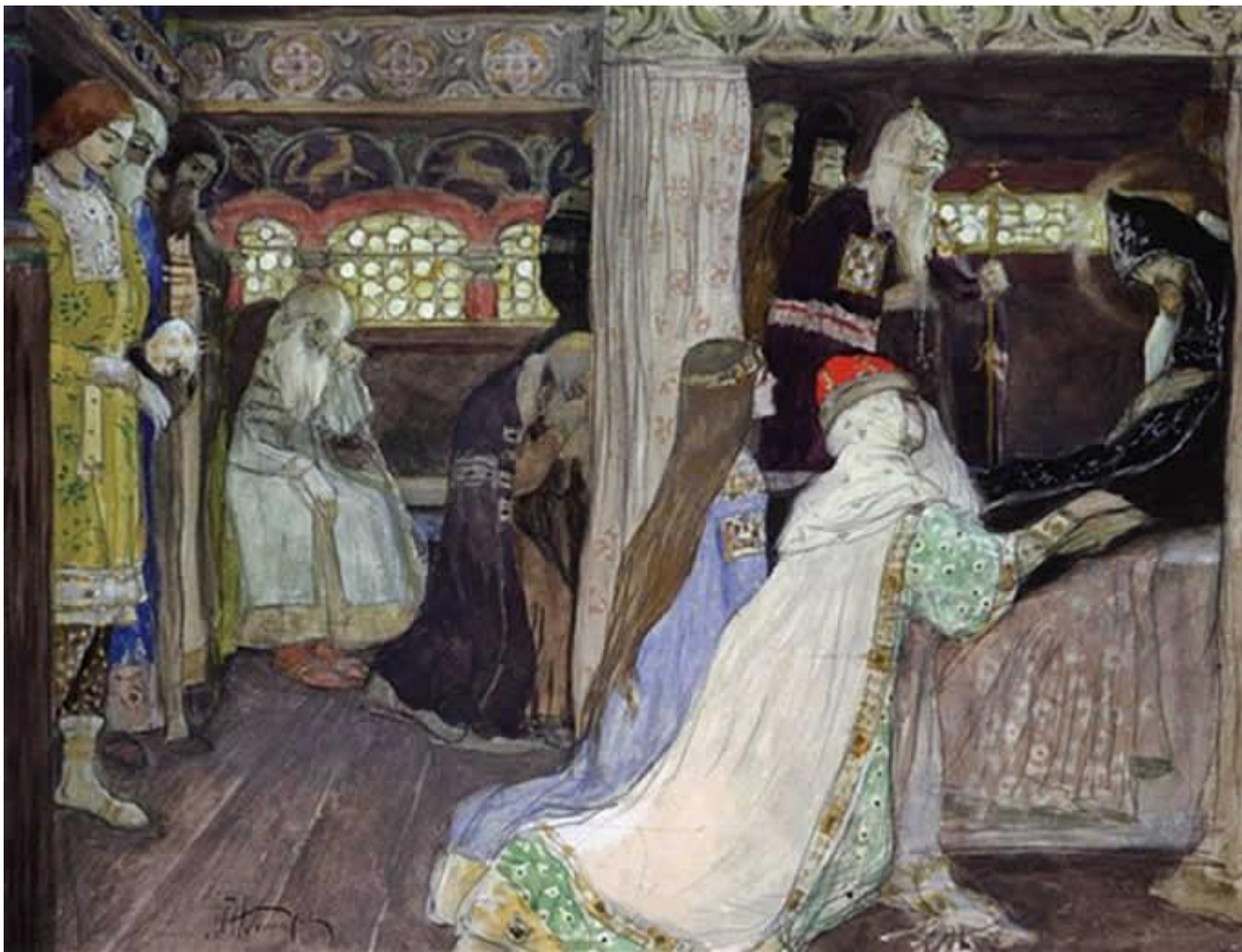
М. В. Нестеров «Успение Святого Александра Невского»