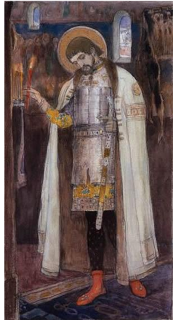
Нестеров М.В. «Святой Александр Невский»