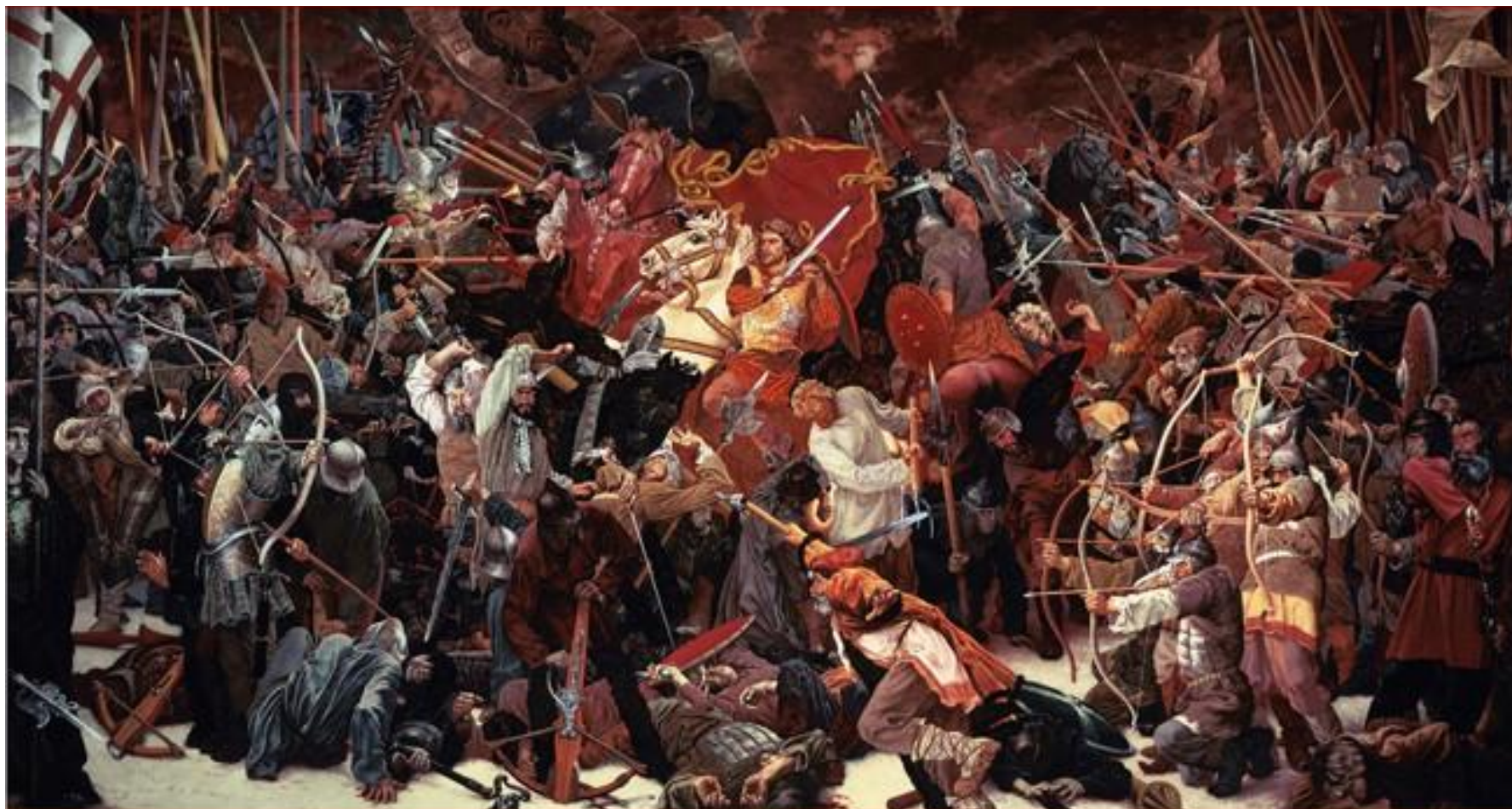
С. Присекин «Кто с мечом к нам придет, от меча и погибнет»