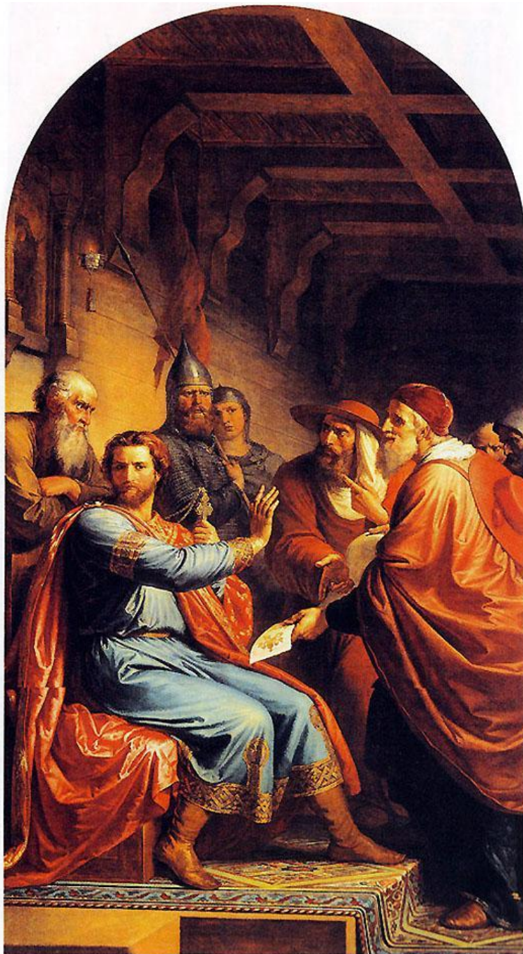
Ф. Моллер. «Александр Невский и папские легаты». Роспись Большого Кремлевского дворца.

Князь ответил отказом. Это был выбор и религиозный, и политический. Александр отдавал себе отчет в том, что Запад не сможет помочь Руси в освобождении от ордынского ига; борьба же с Ордой, к которой призывал папский престол, могла оказаться губительной для страны.