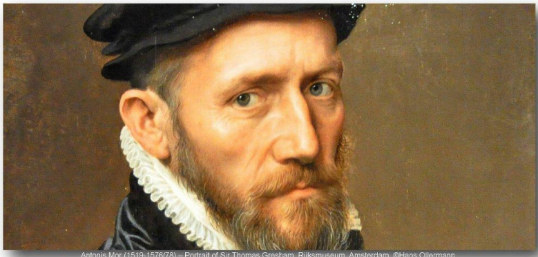
Antonis Mor (1519-1576/78) – Portrait of Sir Thomas Gresham, Rijksmuseum, Amsterdam

Закономерность о «порче монет» стали называть законом Грэшема- по имени английского купца и финансиста Томаса Грэшема (1519-1579), который «переоткрыл» его в XVII в. Одна из трактовок закона: «Худшие деньги вытесняют из обращения лучшие»