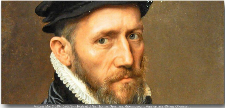
Antonis Mor (1519-1576/78) – Portrait of Sir Thomas Gresham, Rijksmuseum, Amsterdam

Закономерность о «порче монет» стали называть законом Грэшема- по имени английского купца и финансиста Томаса Грэшема (1519-1579), который «переоткрыл» его в XVII в. Одна из трактовок закона: «Худшие деньги вытесняют из обращения лучшие»