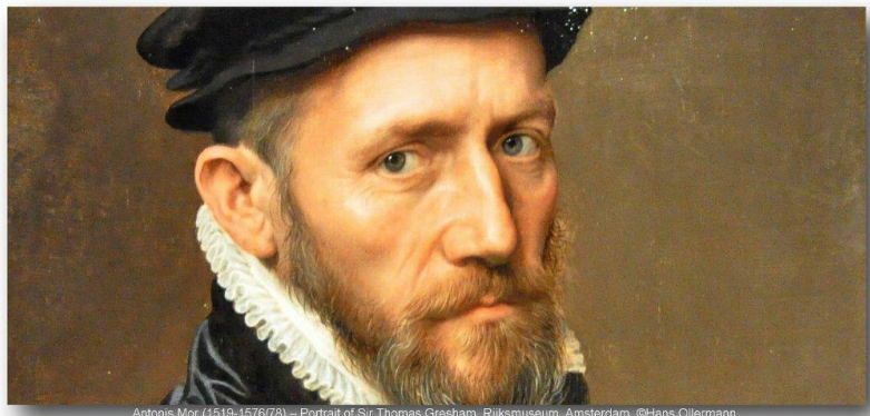
Antonis Mor (1519-1576/78) – Portrait of Sir Thomas Gresham, Rijksmuseum, Amsterdam

Закономерность о «порче монет» стали называть законом Грэшема- по имени английского купца и финансиста Томаса Грэшема (1519-1579), который «переоткрыл» его в XVII в. Одна из трактовок закона: «Худшие деньги вытесняют из обращения лучшие»