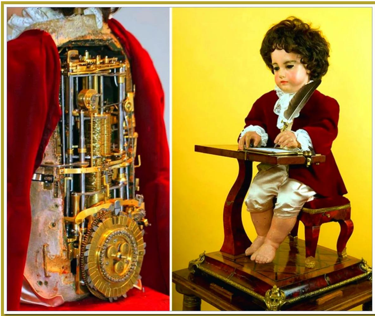
Первый пишущий автомат Фридриха Фон Кнауса (1750)