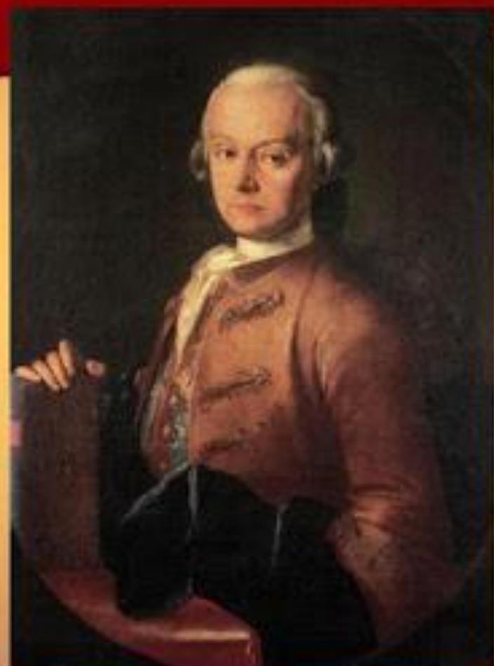
Леопольд Моцарт (отец)

Моцарт родился в небольшом австрийском городе Зальцбурге. При крещении на второй день от роду ему было присвоено длинное имя. Однако в народе его именуют сокращенно - Вольфганг Амадей Моцарт. Его отец являлся известным музыкантом. Именно он обучил маленького композитора игре на пианино, органе и скрипке.