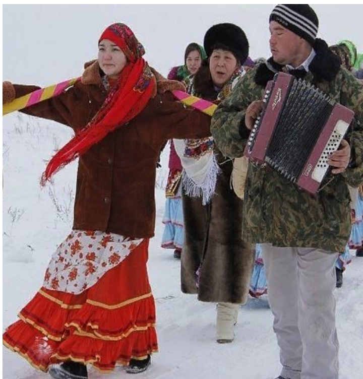
Национальный праздник – Боз карау