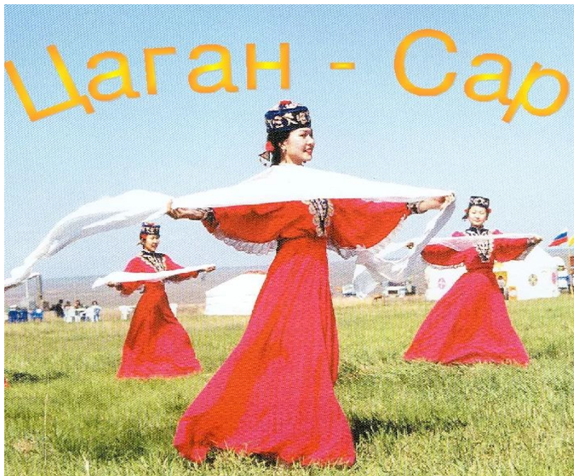
Национальный праздник – Цаган-Сар