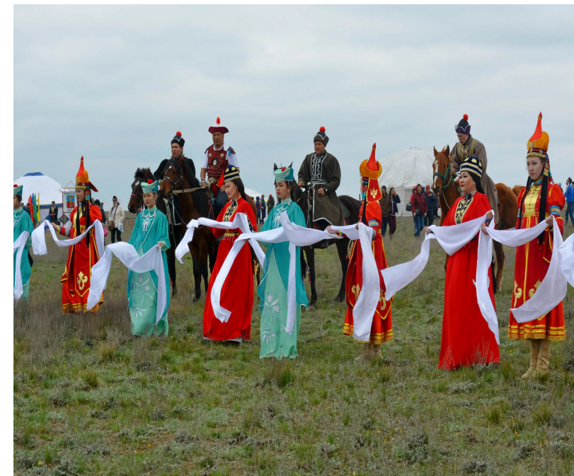
Национальный праздник – «Фестиваль тюльпанов»