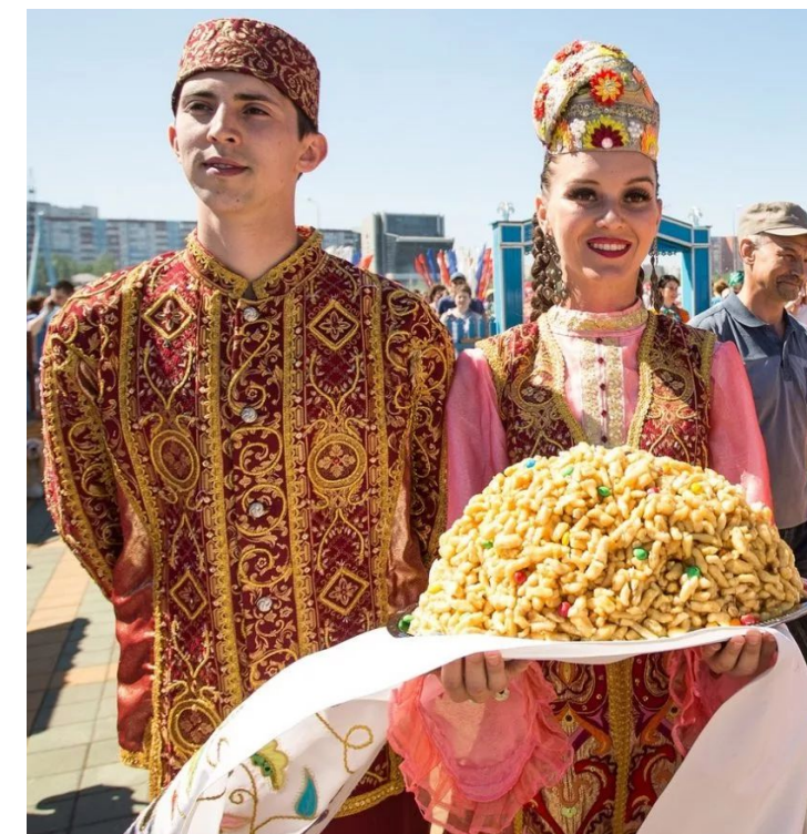
Национальный праздник – Сабантуй