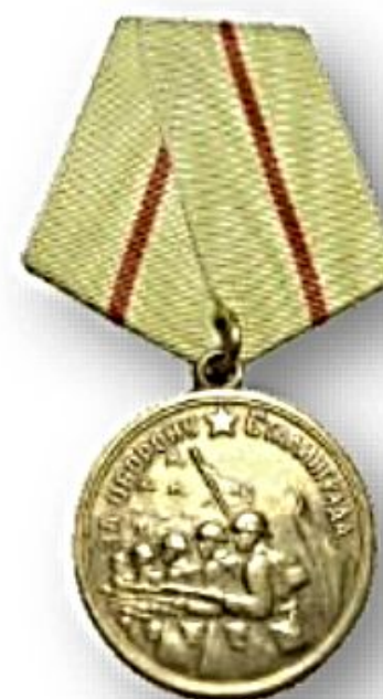
Медаль «За оборону Сталинграда»