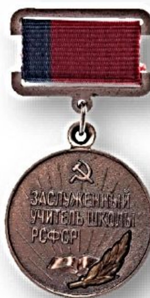
Нагрудной знак «Заслуженный учитель РСФСР»