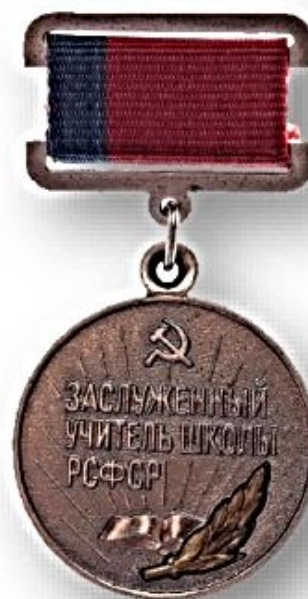
Нагрудной знак «Заслуженный учитель РСФСР»