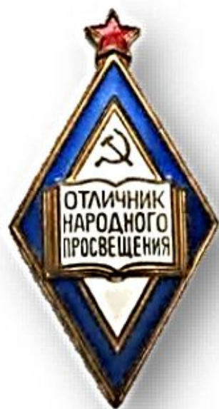
Нагрудной знак «Отличник народного просвещения»