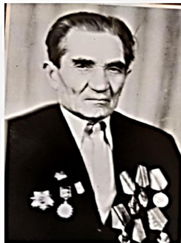
Орден Отечественной войны 2 степени