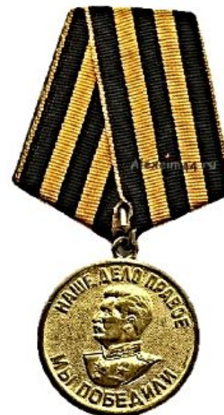
Медаль «За победу над Германией в Великой Отечественной войне 1941—1945 гг.»