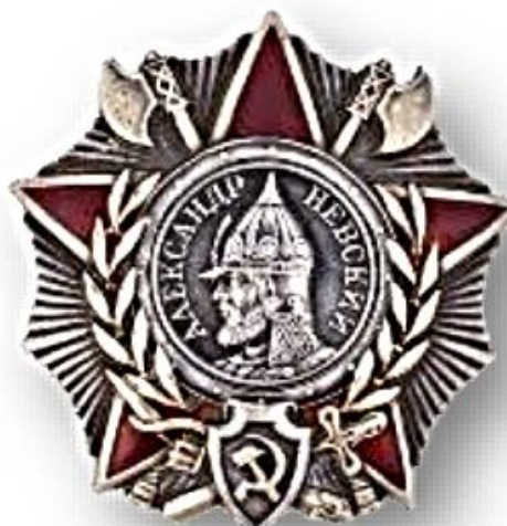
Орден Александра Невского (02.05.1944)