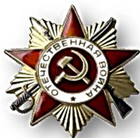
Орден Отечественной войны I степени (24.03.1943)