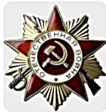
Орден «Отечественной войны 1 степени»