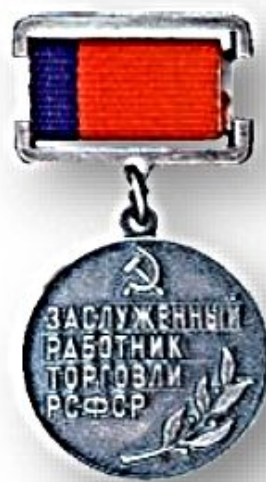
Нагрудной знак «Заслуженный работник торговли РСФСР»