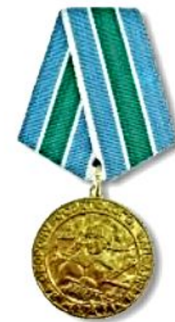
Медаль «За оборону Советского Заполярья»