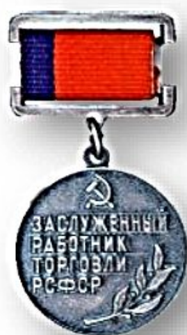
Нагрудной знак «Заслуженный работник торговли РСФСР»