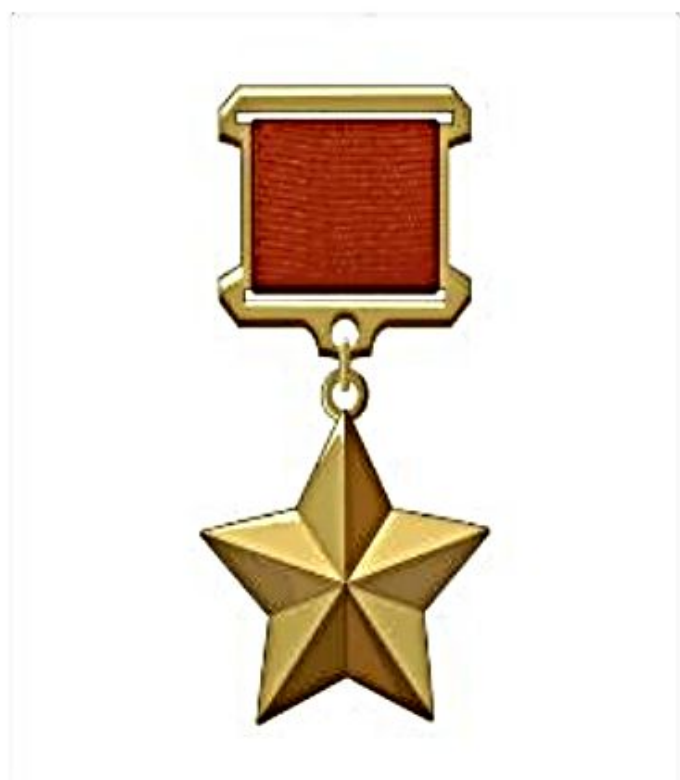
Медаль «Золотая Звезда» Героя Советского Союза (25.10.1938, № 103)