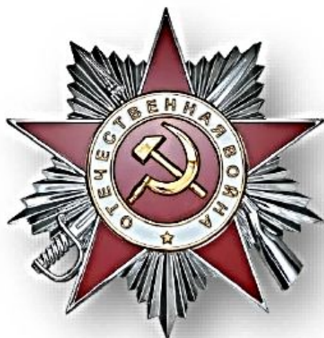
Орден Отечественной войны 2 степени