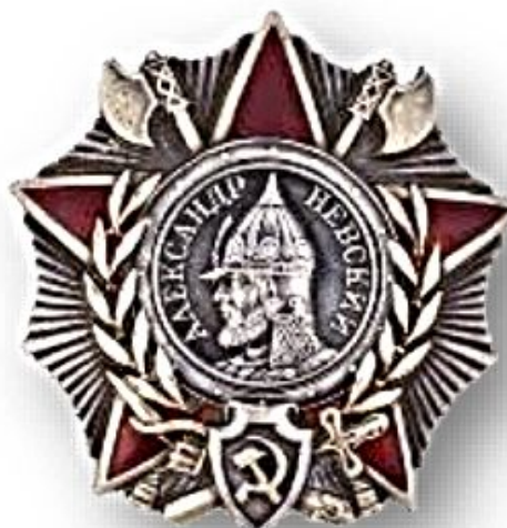
Орден Александра Невского (02.05.1944)