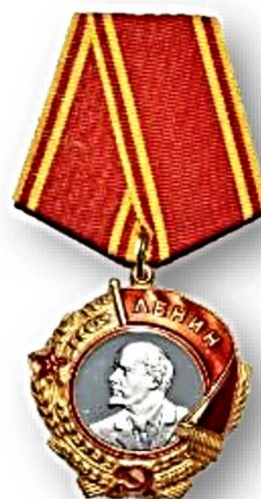
Орден Ленина (25.10.1938)