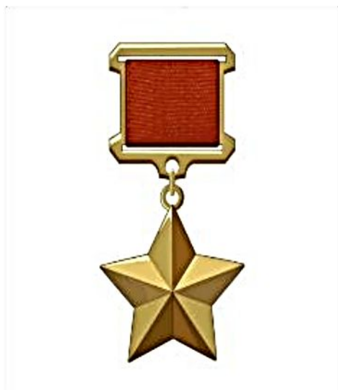
Медаль «Золотая Звезда» Героя Советского Союза (25.10.1938, № 103)