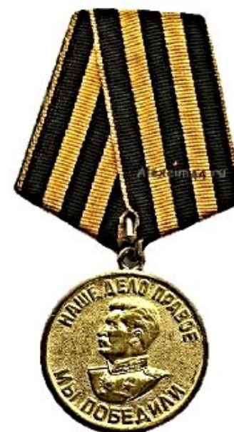
Медаль «За победу над Германией в Великой Отечественной войне 1941—1945 гг.»