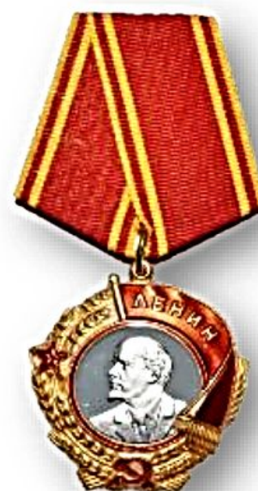
Орден Ленина (25.10.1938)