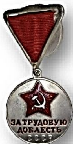
Медаль «За трудовую доблесть»