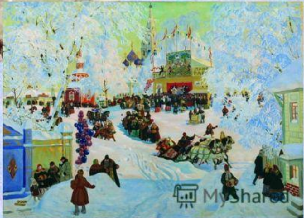
Кустодиев. «Масленица». 1919