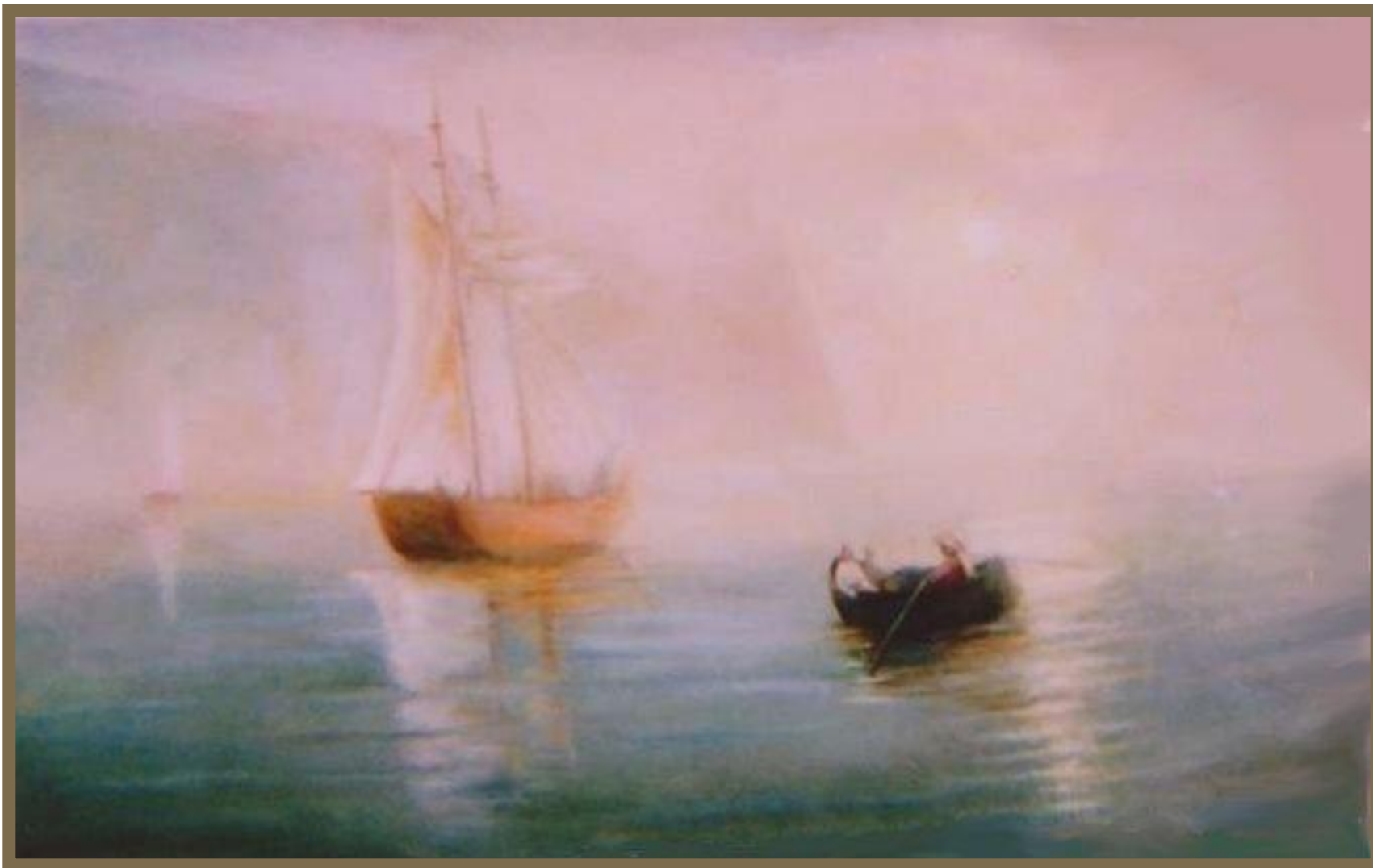
Айвазовский. «Аю – Даг в туманный день».