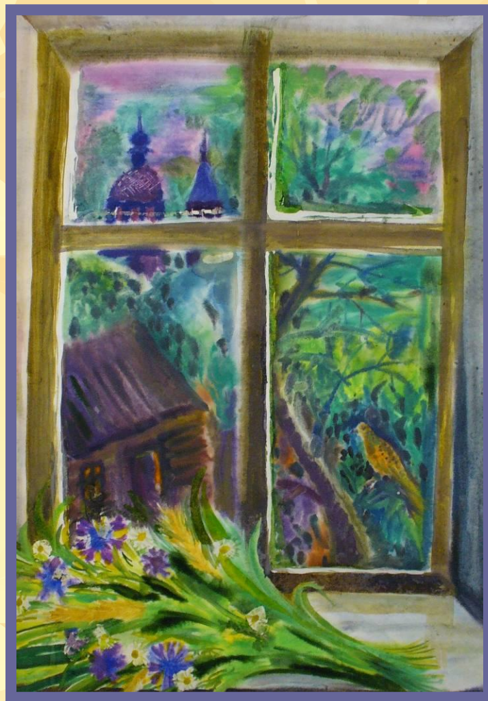
Эмблема музея «Окно в природу»