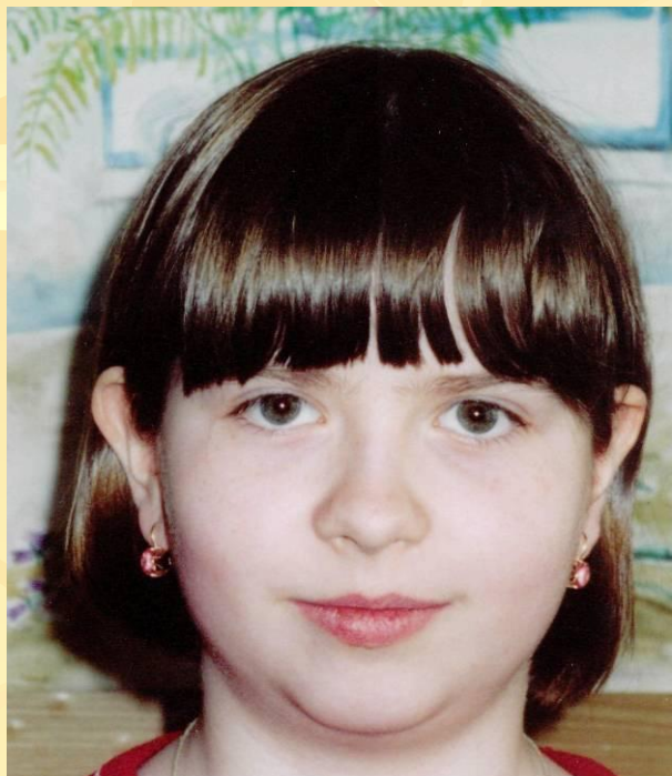
Автор эмблемы музея Анцупова Маша