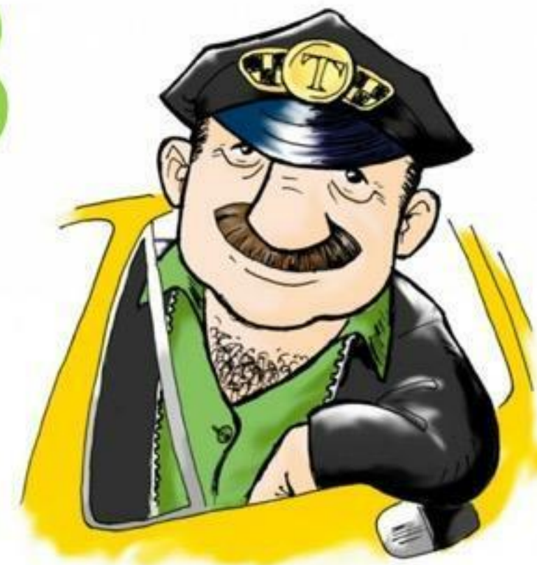
Таксист, гражданин Армении