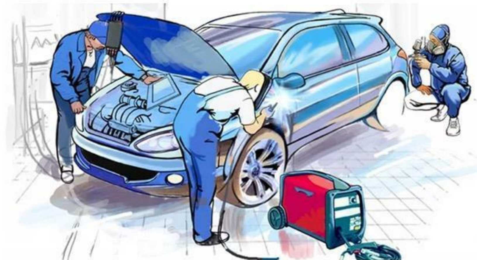
Владелец гаражной мастерской (2 сотрудника)