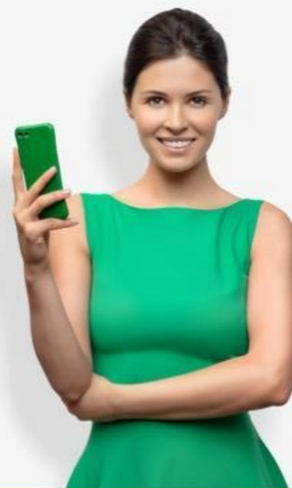
Сотрудники на ГПХ