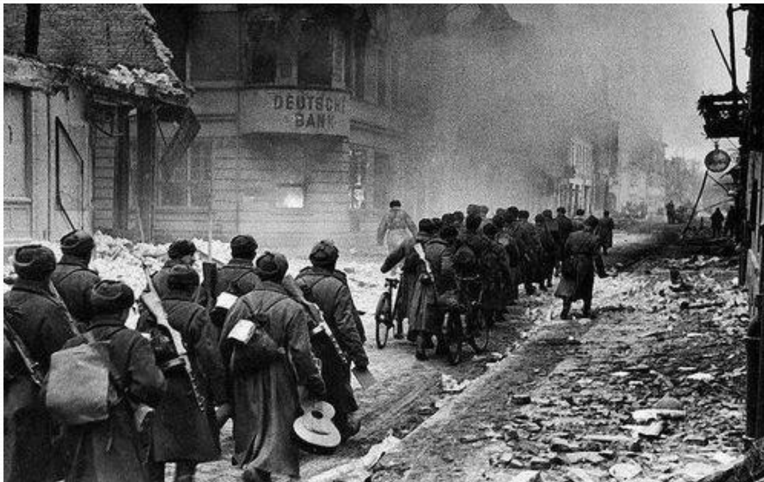
Данциг март 1945г.