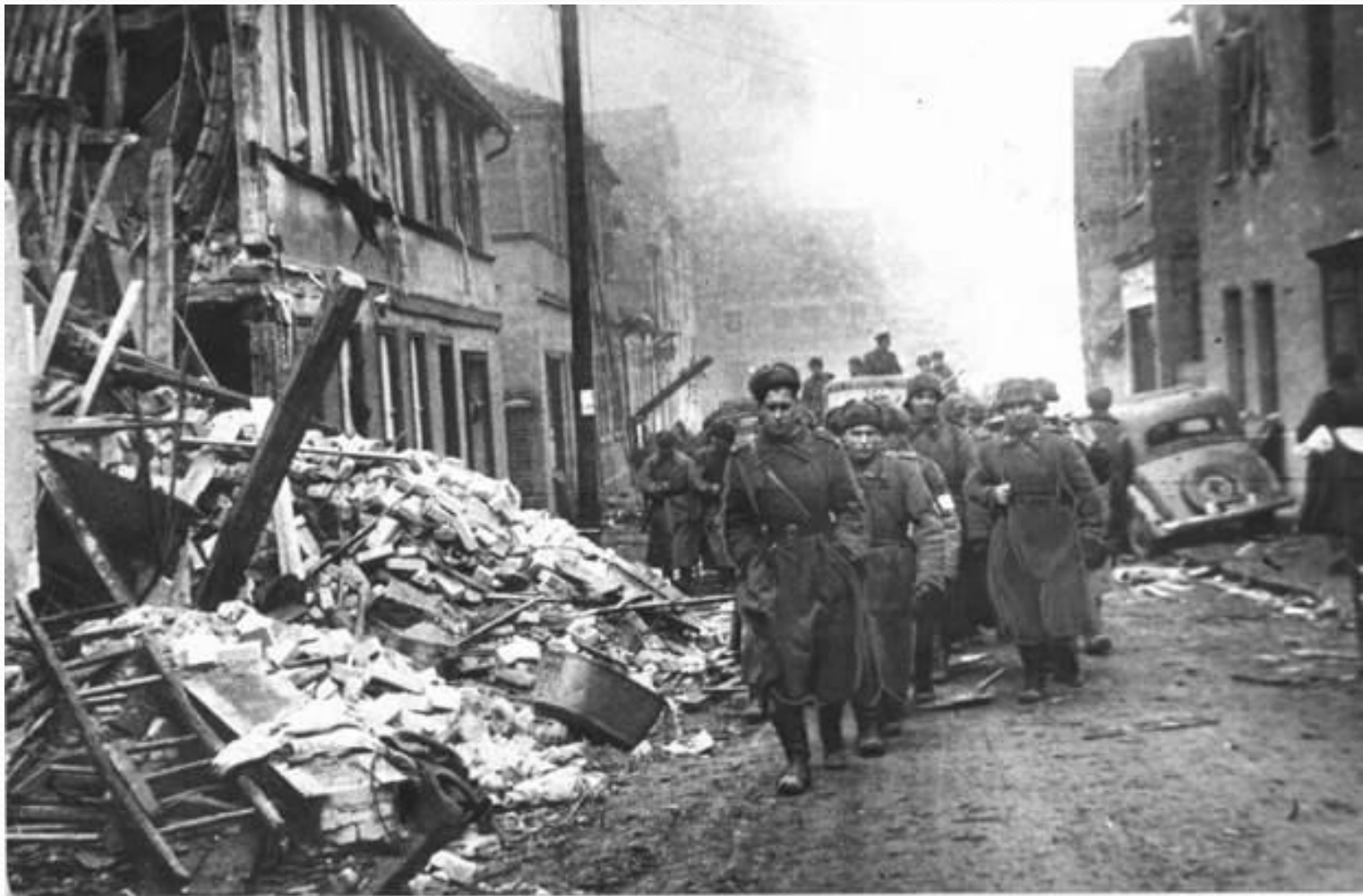
Советские солдаты в Альтдамме.