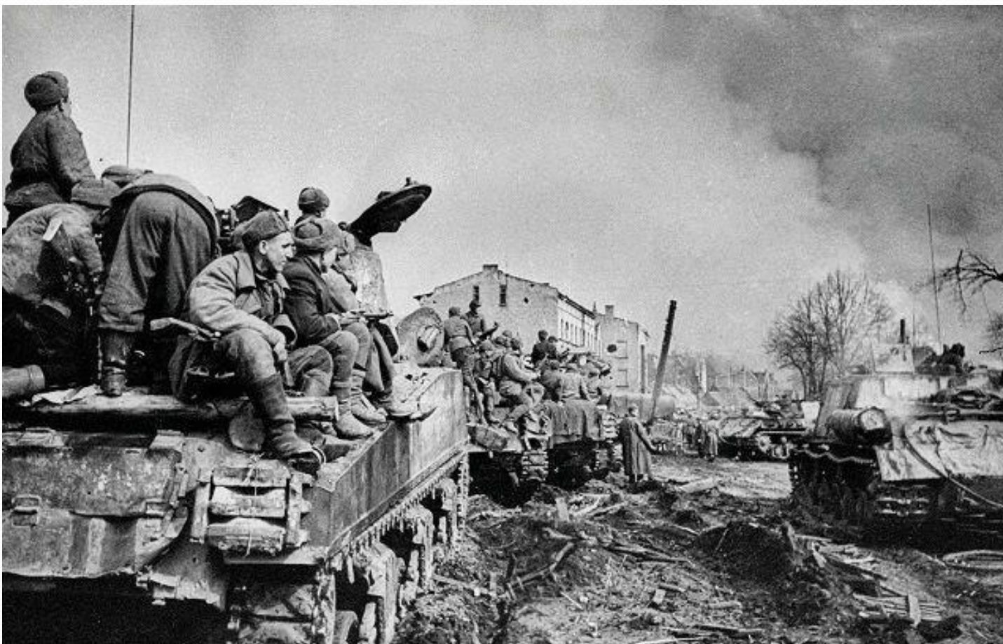
Уличные бои в Гдыне 1945 г.