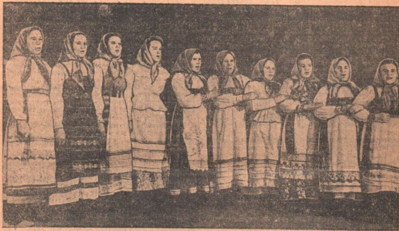
Хор колхоза «Великий Октябрь», Нюксенского района.

участников областного смотра художественной самодеятельности