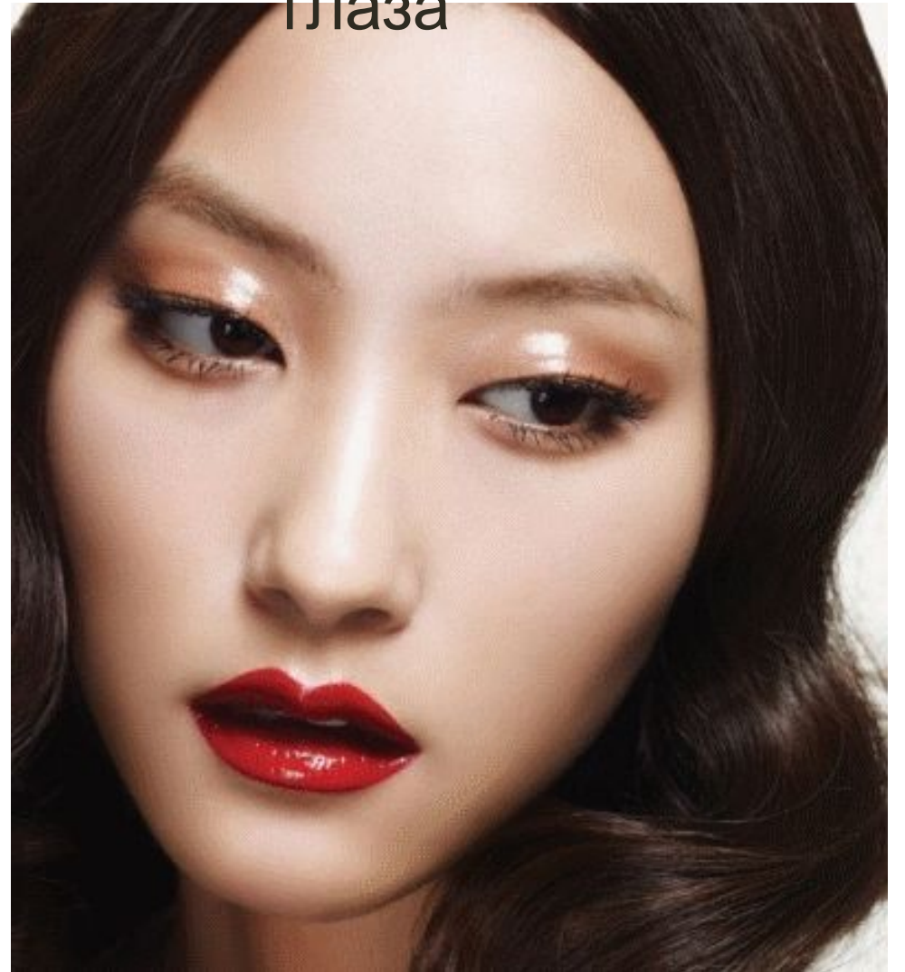
Если нужно раскрыть