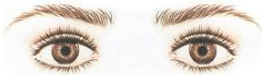
Широко посаженные глаза