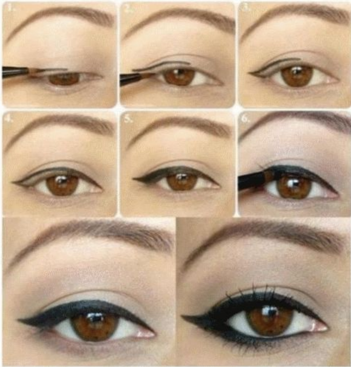
Если нужно удлинить близко