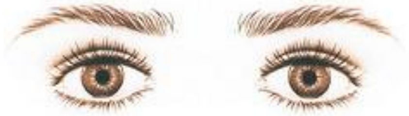
Опущенные уголки глаз