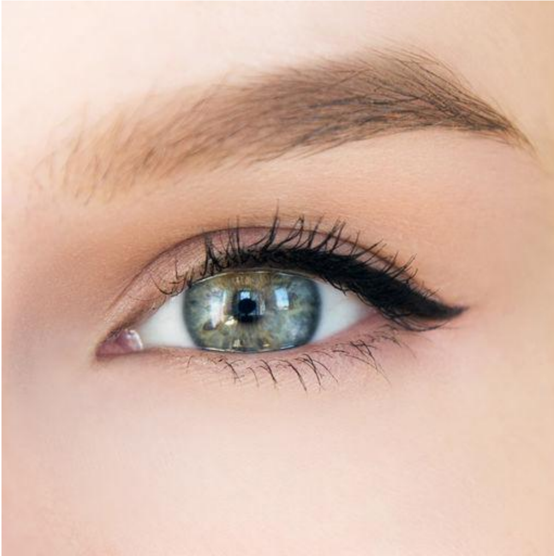
Стрелка на \frac{3}{4} глаза