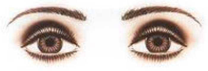
Глубоко посаженные глаза