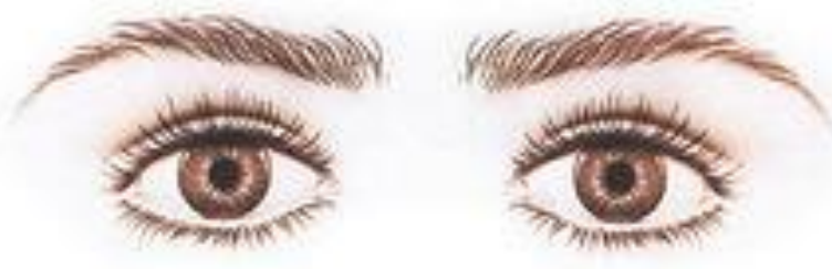
Близко посаженные глаза