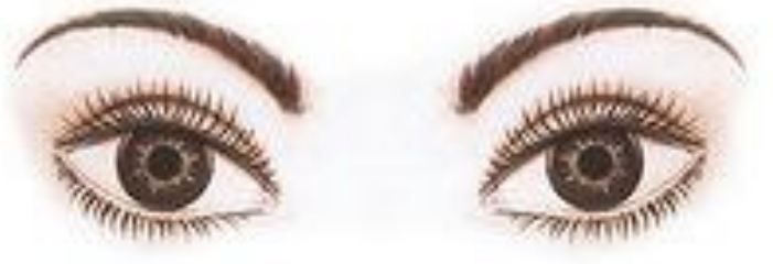
Приподнятые уголки глаз (азиатские глаза)