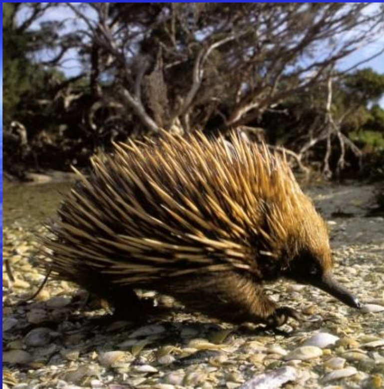
Ехидна- млекопитающее яйцекладущее с самой низкой температурой тела- + 22°С