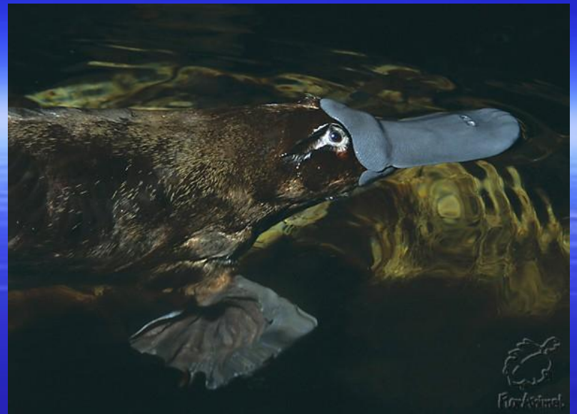
Утконос- яйцекладущее млекопитающее как бы собранное из частей других животных