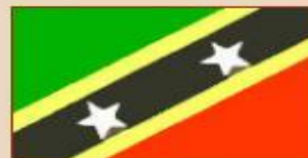
Сент-Китс и Невис