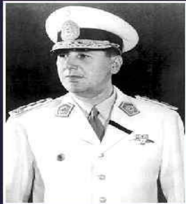
Хуан Доминго Перон (1895 – 1974)

ПЕРОНИЗМ – САМОЕ МАССОВОЕ И ВЛИЯТЕЛЬНОЕ ДВИЖЕНИЕ ЭПОХИ НАЦИОНАЛ-РЕФОРМИЗМА