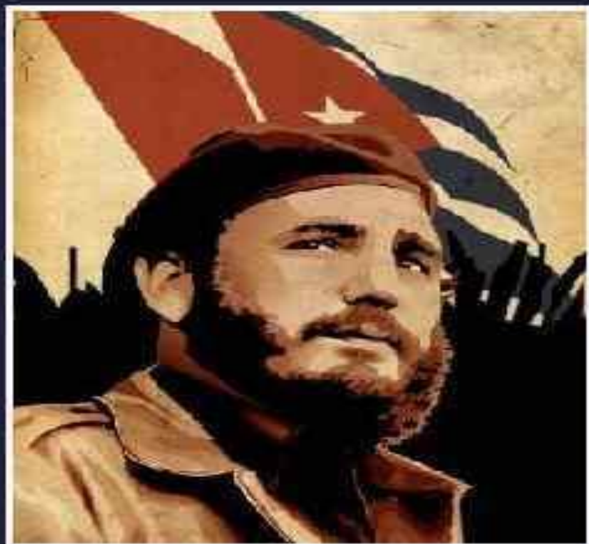
Фидель Кастро (род в 1926 г.)

Ещё в студенческие годы он примкнул к левому движению. После прихода к власти на Кубе Ф.Батисты 26 июля 1953 г. возглавил вооружённое нападение группы молодых патриотов на казарму Монкада в Сантьяго-де-Куба, закончившейся неудачно. Был арестован и приговорён к 15 годам тюрьмы, но вы 1955 г. освобождён и уехал за границу. 2 декабря 1956 г. Кастро с группой сторонников высадился на Кубе. Он и его соратники дали обещание не стричь бород до полной победы. Их называли поэтому «барбудос» - бородачи. В результате развернувшейся партизанской войны диктатура Батисты пала, а Кастро с февраля 1959 г. стал премьер-министром Кубы. Он объединил все революционные организации в единую партию, с 1965 г. получившую название Коммунистической партии Кубы, и возглавил её.