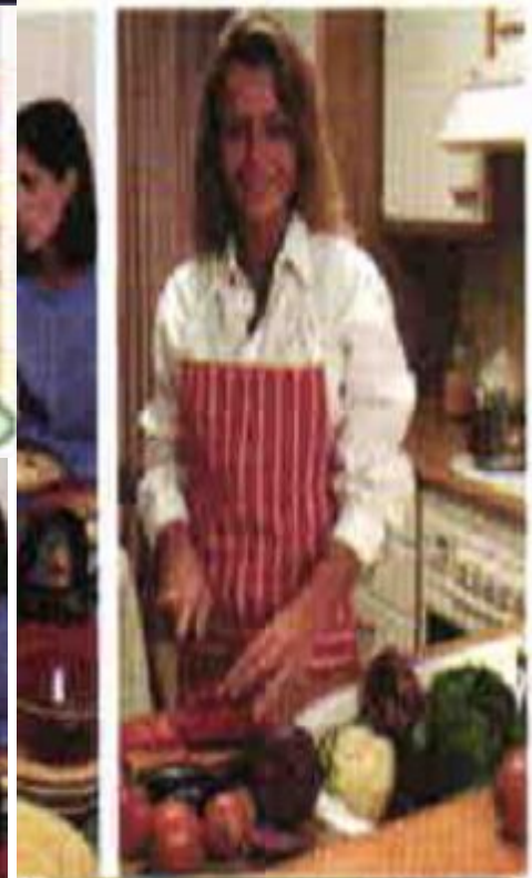
cook special food