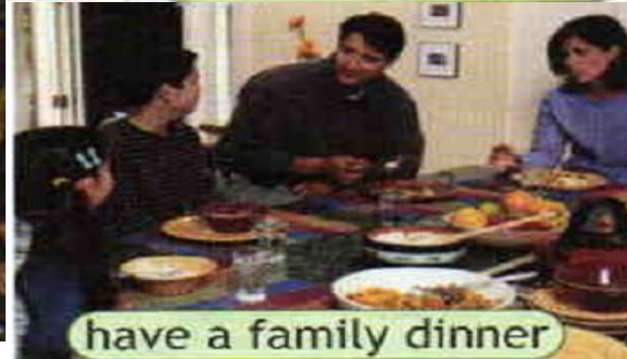
have a family dinner