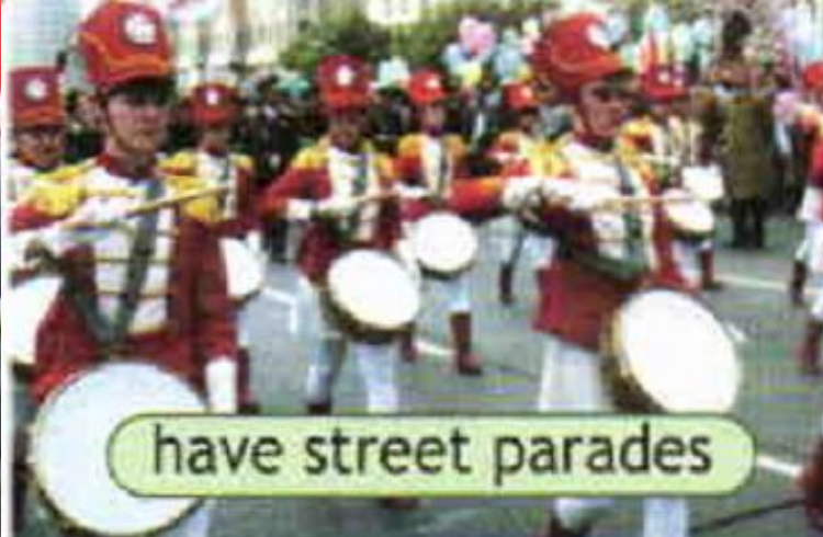
have street parades