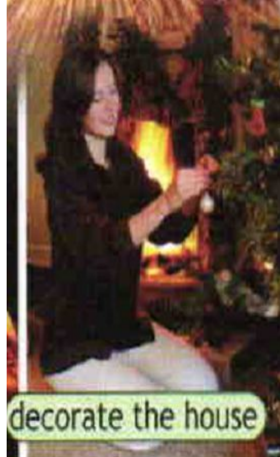
decorate the house