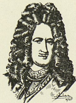
А. Д. Меншиков