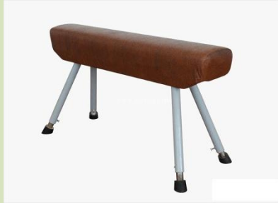
Снаряд в спортивной гимнастике