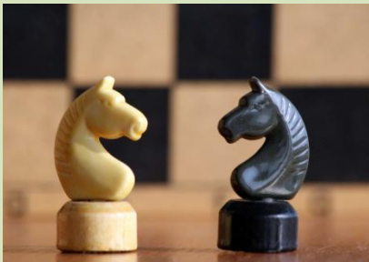
Шахматная фигура с изображением конской головы