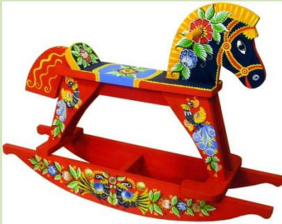
Детская игрушка, изображающая лошадь