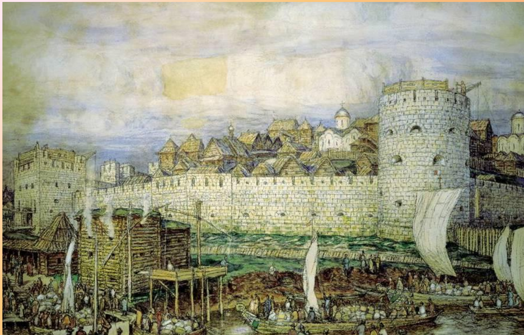
Белокаменный Кремль в Москве при Дмитрии Донском (с картины А.М. Васнецова)

период разработки пожарно-профилактических мер (середина XIV — середина XVI века)